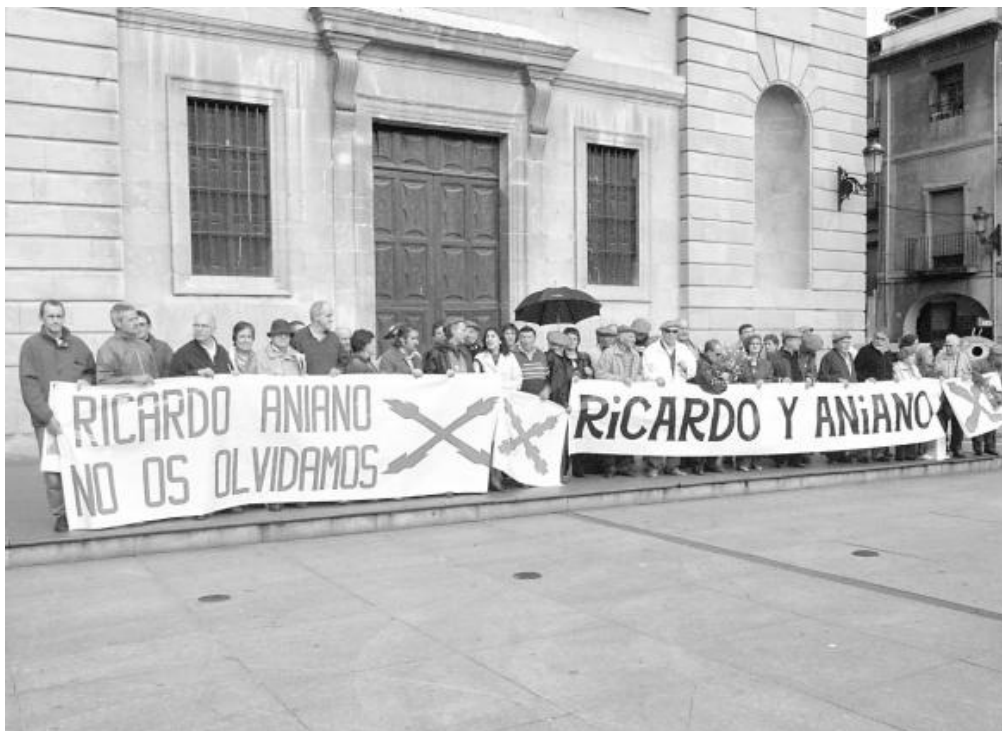
Manifestación en Lizarra – Estella, en un recordatorio a los jóvenes asesinados en Montejurra en 1976.

Montejurra, como a tantos otros que han participado activamente de la dictadura franquista.