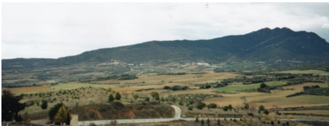
El Jurramendi – Montejurra – visto desde Oteiza de la Solana.

- carlista - y Espartero – liberal -; la tercera, entre 1872 y 1876, significó el fin del carlismo armado, transformado luego en una fuerza política.