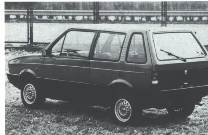
Nella pagina precedente: Alfa Romeo Z 33 Tempo Libero vista posteriormente. Sopra: interno della vettura e parte posteriore. Sotto: quattro modi per utilizzare gli spazi interni della Tempo Libero. I sedili ripiegabili permettono anche di formulare un'ipotesi camper.

free time, Zagato presents two more new models at the Ginevra Motor Show: the Alfa Romeo 2000 SW, a classic and elegant break, designed in connection with the Italian periodical Auto Capital, and a sharp model of the Lancia Delta GT.