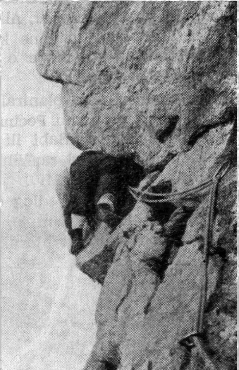
Prvo svladavanje Brahmova smjera.