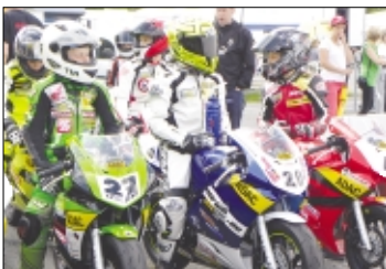
Packende Rennen liefern sich die jungen Fahrer am 16. und 17. Juni in Faßberg.

Die Zufahrt zur Rennstrecke erfolgt über die Hauptachse des Fliegerhorsts Faßberg und ist ausgeschildert. Der Eintritt ist frei und für das leibliche Wohl ist an dem rennwochenende ebenfalls gesorgt.