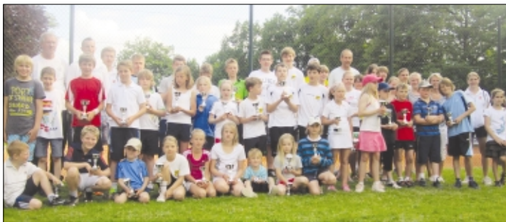
Präsentieren stolz ihre Pokale: die jungen Siegerinnen und Sieger der Tennis-Jugendregionsmeisterschaften in Soltau.

2. Tennis-Jugendregionsmeisterschaften in Soltau