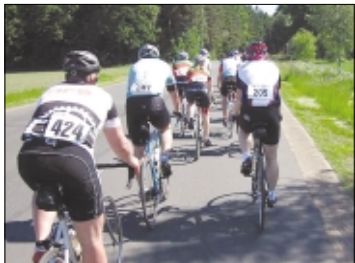
Sportliche Radler bei der 8. RTF in Müden auf der Strecke.

Schuckentreiber aus Müden, Mitglieder von Fortuna Celle und TuS Celle sowie die private Radgruppe Main-Plan aus Buchholz in der Nordheide. Ausführliche Infos mit Bildern gibt es im Internet unter www.helmutsfahrad-seiten.de und unter www.mtvmueden.de .