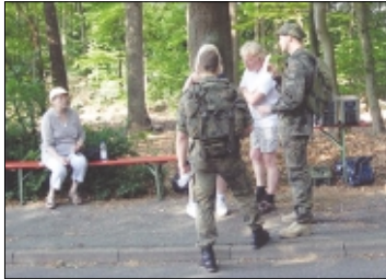
Am kommenden Wochenende sind alle Wanderbegeisterten zum zivil-militärischen „Heidemarsch“ in Munster willkommen.