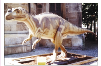
Zahlreiche Dinosaurier-Modelle - größtenteils in Lebensgröße - sind am kommenden Wochenende in Soltau zu bestaunen.

SOLTAU. Vor etwa 225 Millionen Jahren begann die Zeit der Dinosaurier, die danach mehr als 160 Millionen Jahre lang bis zum Ende der Kreidezeit die Erde beherrschten. Wer mehr über die vielen verschiedenen Arten dieser größten Landbewohner aller Zeiten und ihre Lebensweise erfahren möchte, kann am kommenden Wochenende die Entwicklung der Urzeit-Riesen verfolgen: Am 8. und 9. November ist Europas einzige mobile Dinosaurier-Ausstellung in Soltau zu Gast und zeigt an diesen Tagen jeweils von 11 bis 17 Uhr das Leben der gigantischen Echsler. Zu sehen sind hier unter