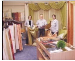
Fachberatung zu den aktuellen Kollektionen bietet das Team auch in der Gardinenabteilung.