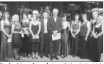
Über Gutscheine von Soltauer Gastronomiebetrieben freuten sich die Gewinner der Tombola.