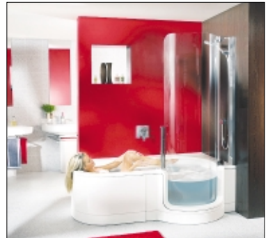
Die perfekte Verbindung für Badespaß oder Duschvergnügen: „TWINLINE“.

Spritzschutz. Die Tür aus Sicherheitsglas hält absolut dicht, wenn Wasser in der Wanne ist. Da läuft kein Tropfen aus, die Dichtung hält absolut dicht. Ein Sicherheitsverschluß garantiert, daß die Tür während des Badens nicht versehentlich geöffnet werden kann. Neben all diesen sehr praktischen Details bietet die „TWINLINE“ auch jede Menge Komfort. Dank einer weichen Nackenstütze kann der sich „Badegast“ völlig entspannt zurücklehnen. Ein in den Wannenrand integrierter Sitz ermöglicht die Körperpflege der bequemeren Art. Für mehr Standsicherheit kann die Duschzone mit rutschhemmender ART-Grip Beschichtung ausgestattet werden. Die neue „TWINLINE“ verbindet das Beste aus zwei Welten: Niemand muß sich jemals wieder zwischen Badewanne oder Dusche entscheiden.