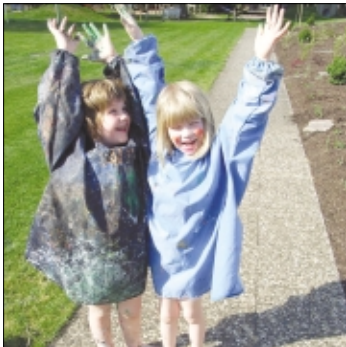
„Mit Kindergruppen ...“ - unter diesem Motto steht der Tag der offenen Tür, bei dem sich der Vorschulbereich der Lebenshilfe Soltau der Öffentlichkeit vorstellt.

SOLTAU (mw). Für die Lebenshilfe Soltau ist 2008 ein ereignisreiches Jubiläumsjahr: 1968 gegründet, begeht sie ihren 40. Geburtstag und nutzt diesen Anlaß, um sich der interessierten Öffentlichkeit zu präsentieren (HK berichtet). Am kommenden Sonnabend, dem 8. November, nun stellt sich der gesamte vorschulische Bereich im Rahmen eines Tages der offenen Tür vor: Von 14 bis 17 Uhr sind kleine und große Besucher in der Einrichtung in Soltau-Weiher willkommen, um die verschiedenen Gebiete unter dem Motto „Mit Kindergruppen ...“ kennenzulernen.