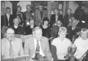
15 Hobbymusiker bilden heute den Musikkreis Neuenkirchen.