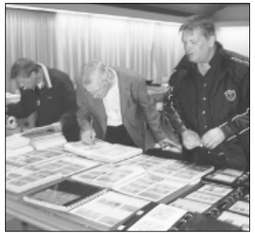
Ein Großtauschtag des Briefmarken- und Münzensammlervereins Schneverdingen steht am 9. November in der FZB auf dem Plan.

Die Vereinsmitglieder zeigen in großen Ausstellungsrahmen und Vitrinen auf einer Fläche von rund 50 Quadratmeter Auszüge aus 20 Sammlungen. Sie stellen teilweise selbstgestaltete Ländersammlungen, ebenso wie verschiedene Motivsammlungen aus den Themenbereichen Natur, Technik und Sport vor. Ferner sind dokumentarische Sammlungen zu sehen, die geschichtliche Inhalte aufzeigen. In einem weiteren Ausstellungsteil werden alte Ansichtskarten und Fotos mit Schneverdingener Motiven präsentiert. Dazu bietet der Verein Reproduktionen von zwei alten kolonierten Schneverdingen „Grütkarten“ mit jeweils fünf Ansichten des Heidedorfes aus der Zeit um 1895 an. Auch Belege mit dem ersten Schneverdingener Sonderstempel und andere dekorative Karten und Umschläge mit weiteren