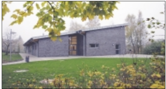
Herbstimpression: Die neue Mensa der KGS Schneverdingen.

Weiterhin sind in dem Neubau ein Büro für die Sozialpädagoginnen der Schule, ein Multifunktionsraum sowie sanitäre Anlagen zu finden. Schmidt betonte, daß das Gebäu-