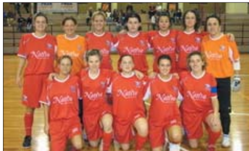
Le Lupe, capolista del campionato veneto

Sarà un turno davvero infuocato e ricco di spettacolo quello che mette in programma la quindicesima giornata del campionato femminile di Serie C veneta, in quella che di fatto sarà la terza del girone di ritorno. Due le sfide da non perdere tra alcune delle formazioni più accreditate per la vittoria finale o, quanto meno, per un posto nei play-off.