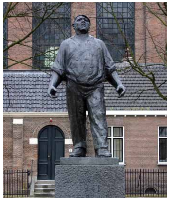
De staking wordt jaarlijks op 25 februari herdacht bij het standbeeld "De Dokwerker" van beeldhouwer Mari Andriessen op het Jonas Daniël Meijerplein in Amsterdam. De herdenking staat in het teken van de blijvende strijd tegen fascisme en racisme.