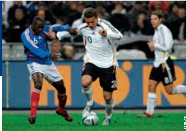
Lukas Podolski résiste au Français Makelele dans une rencontre amicale.