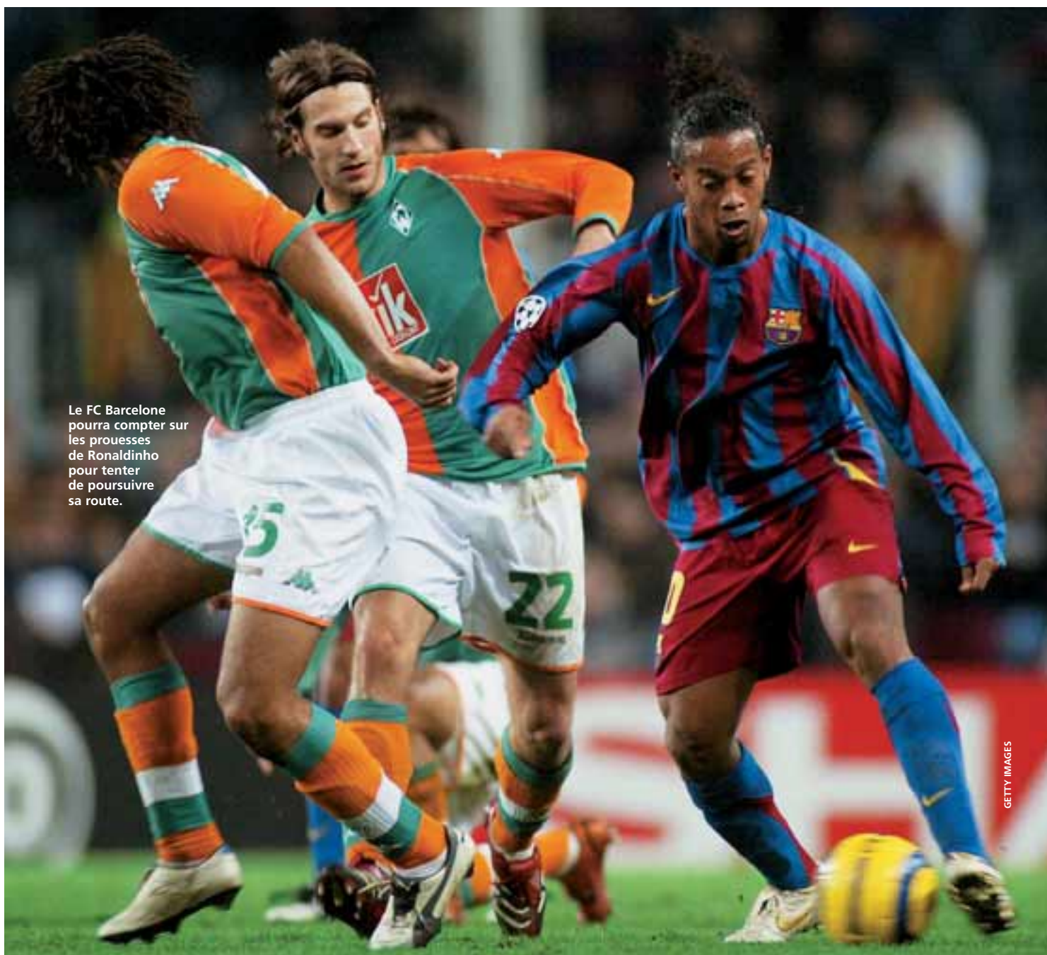
Le FC Barcelone pourra compter sur les prouesses de Ronaldinho pour tenter de poursuivre sa route.

C'est le rendez-vous de deux outsiders et, en même temps, des deux seules équipes qualifiées qui, depuis l'introduction de la phase de groupes en Ligue des champions de l'UEFA, n'étaient encore jamais parvenues à aller au-delà de celle-ci. Villarreal qui est dirigé par le Chilien Manuel Pellegrini a, contre toute attente, bien surmonté le double fardeau de la Ligue des champions et du championnat national et s'est imposé de manière convaincante au sein d'un groupe D âprement