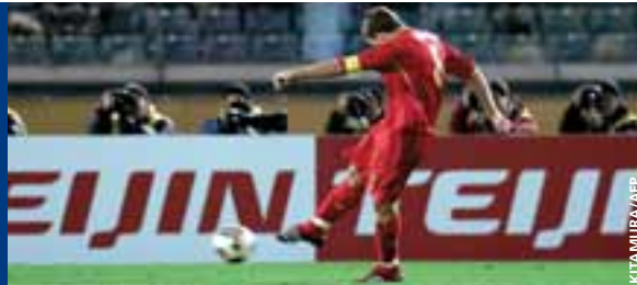
Steven Gerrard arme un tir victorieux contre Deportivo Saprissa.