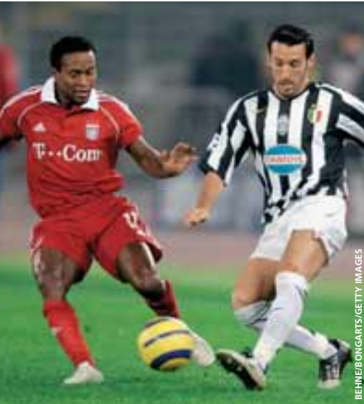
Fabio Cannavaro (à droite) et la Juventus sont en forme mais le Bayern Munich de Ze Roberto leur a montré qu'il avait du répondant.