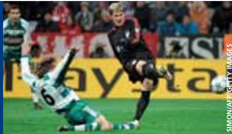
Bastian Schweinsteiger, un des espoirs de Bayern Munich.