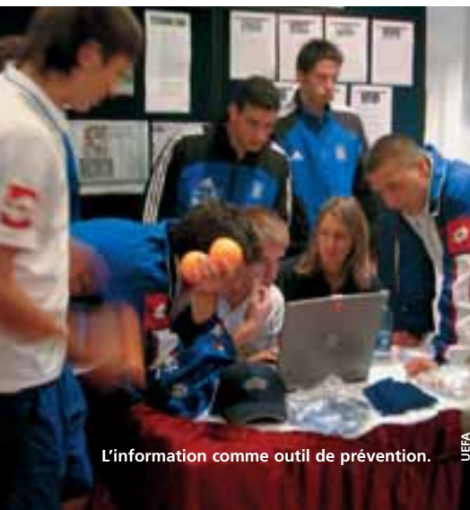
L'information comme outil de prévention.

Portant son message au-delà des terrains de jeu, l'unité antidopage de l'UEFA participe régulièrement à des conférences sur le sujet. L'Unité Sport de la Commission européenne, le Conseil de l'Europe, les agences nationales antidopage portugaise, slovaque, russe ont invité l'UEFA à communiquer sur ses actions. Les institutions et les gouvernements européens ont déjà salué le travail effectué.