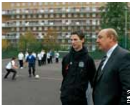
Brian Barwick en visite à South Kilburn.

Le football est utilisé pour s'attaquer à beaucoup de problèmes sociaux dans quelques-unes des communautés les plus démunies d'Angleterre au moment où entre en action le nouveau projet pour les jeunes de la Fédération anglaise de football (FA), placé sous l'égide du programme HatTrick et doté de 4,5 millions de livres sterling.