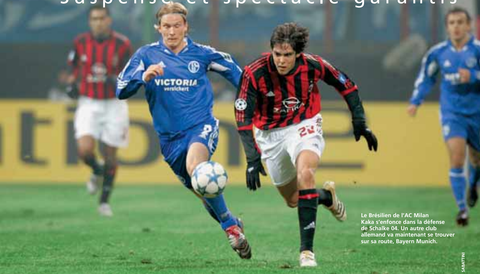
Le Brésilien de l'AC Milan Kaka s'enfonce dans la défense de Schalke 04. Un autre club allemand va maintenant se trouver sur sa route, Bayern Munich.