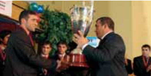
Le capitaine de Pyunik reçoit le trophée de champion des mains du président Ruben Hayrapetyan.