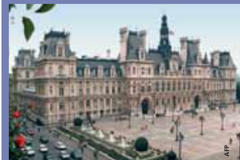
L'Hôtel de Ville de Paris.

Pour mieux imprégner les villes hôtes de l'ambiance des finales, les tirages au sort des quarts de finale et des demi-finales auront lieu dans ces cités. Pour la Ligue des champions de l'UEFA, ce sera le 10 mars à l'Hôtel de Ville de Paris et, pour la Coupe UEFA, le 17 mars au Centre Evoluon d'Eindhoven.