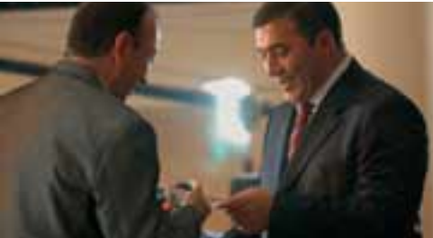
Des représentants des médias ont aussi eu droit à une récompense.