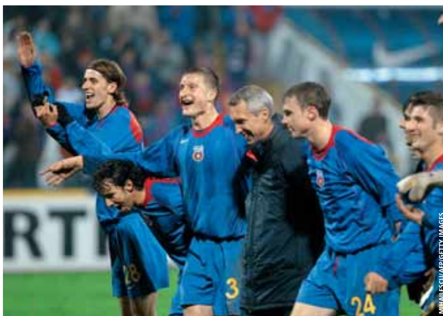
Steaua Bucarest: un test face à Heerenveen pour mieux jurer les possibilités de l'équipe.