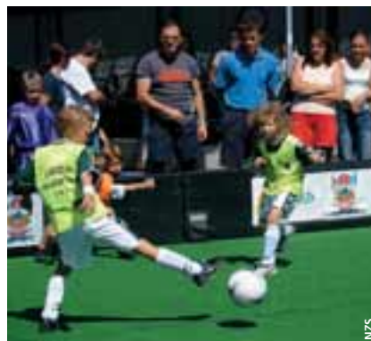
La photo choisie par la Slovénie a remportée le premier prix du concours de l'UEFA dans le cadre de l'Été du football de base.

Le projet «J'aime jouer au football» a donné des résultats formidables ces derniers temps. De plus en plus d'enfants slovènes décident de jouer au football, tout d'abord pour le divertissement qu'il procure puis peut-être à titre profes-