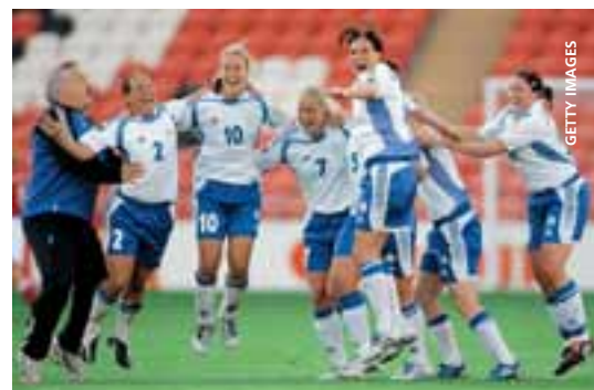
Le football féminin finlandais vit des jours heureux.