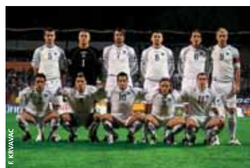
L'équipe nationale de Bosnie-Herzégovine.

«La NSBIH unifiée est encore une jeune organisation mais, saison après saison, nous procédons à d'importantes améliorations dans le champ de l'administration et dans d'autres segments. Chaque