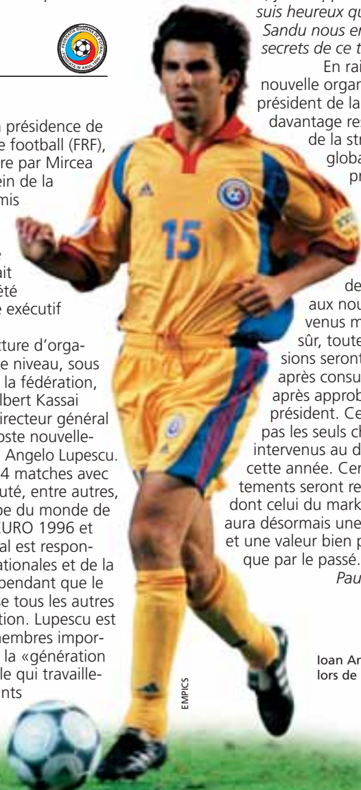
Ioan Angelo Lupescu lors de l'EURO 2000.