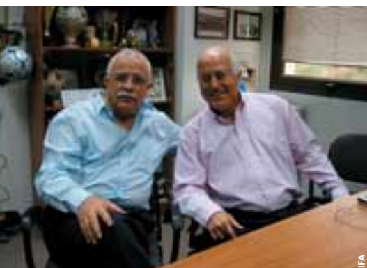
Le président Izhak Iche Menachem et le nouvel entraîneur Dror Kashtan.

Au début d'octobre, l'Autriche, l'Italie et l'Arménie se sont déplacées en Israël dans le cadre du minitournoi féminin des moins de 19 ans, remporté par les Italiennes. Plus tard dans le même mois, l'Arménie, l'Azerbaïdjan et la Russie sont venus en Israël pour le tour qualificatif des moins de 17 ans; la victoire est revenue aux Russes et Israël a également accédé au tour Elite grâce à sa deuxième place. Le groupe 3 des moins de 19 ans qui a été accueilli au même endroit la semaine suivante a vu Israël remporter tous ses matches.