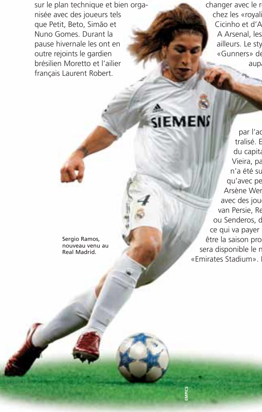
Sergio Ramos, nouveau venu au Real Madrid.

Le duel qui même chez tout amateur de football neutre donne l'eau à la bouche. C'est une rencontre exceptionnelle qui permet d'établir des parallèles: les deux équipes ont obtenu