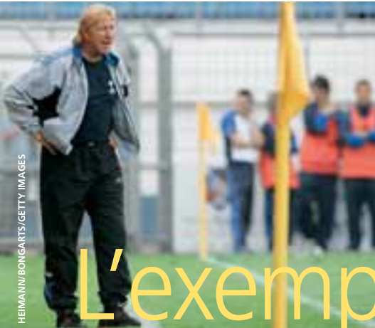
Horst Hrubesch est en charge des moins de 19 ans allemands.