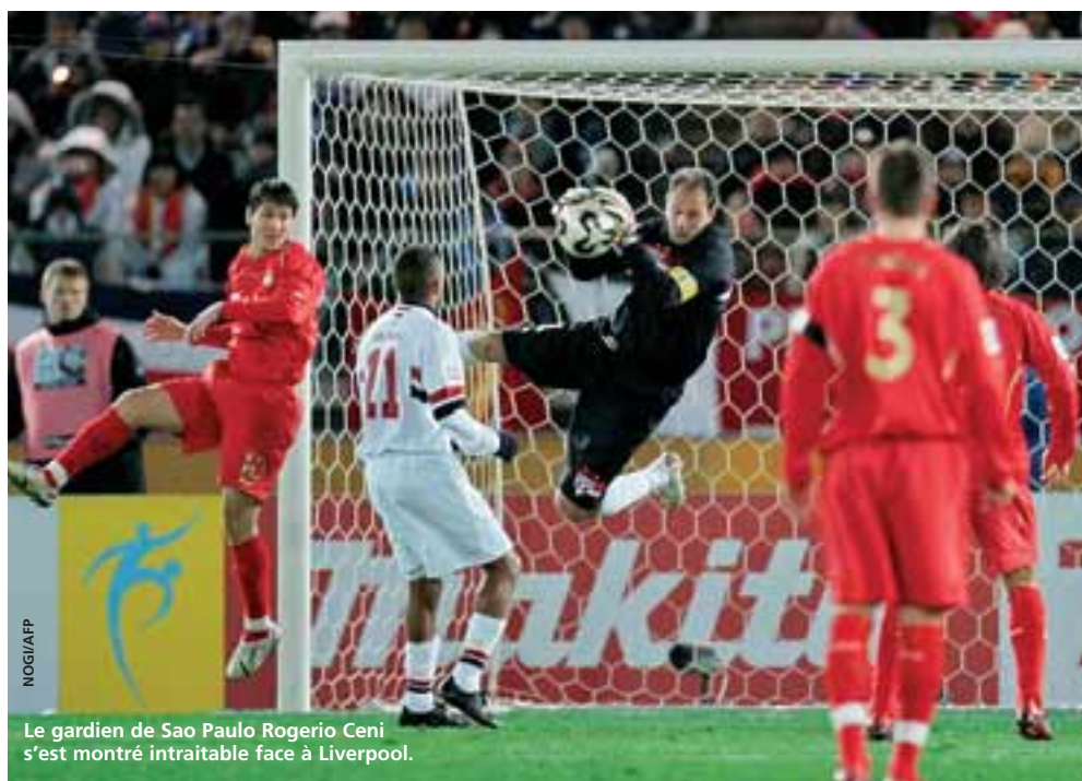
Le gardien de Sao Paulo Rogerio Ceni s'est montré intraitable face à Liverpool.

Deportivo Saprissa a pris la troisième place du tournoi en battant Al Ittihad 3-2. Le FC Sydney a terminé au cinquième rang grâce à son succès 2-1 sur Al Ahly.