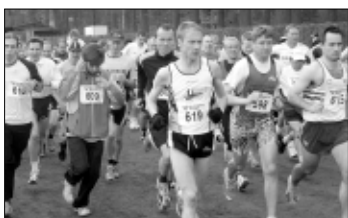
Am kommenden Sonntag steht in Bergen der 17. Sparkassenlauf auf dem Programm.

Die aktive Schulkasse in den Laufwetbewerben erhält 25 Euro für die Klassekasse. Außerdem kann jeder Teilnehmer einen „Sparkassen-Minipok“ erwerben und unter den vorangemeldeten Lauf- und Wal-