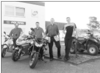
Am kommenden Samstag lädt das Team des Soltauer Motorrad-, Quad- und ATV-Spezialisten „JC & B“ zum Kawa-„Drachenfest“ ein.

SOLTAU. Wer sich auf die kommende Motorrad-Saison einstimmen möchte, den erwarten beim „Drachenfest“ beim Soltauer Zweirad-, Quad- und ATV-Spezialisten „JC & B“ im Gewerbegebiet Almhöhe 13-15 jetzt viele Highlights und Neuheiten. Am kommenden Samstag, dem 21. April, können Biker hier von 9 bis 16 Uhr die insgesamt sieben neuen Kawasaki-Modelle in Augenschein nehmen und jede Menge „Benzin-Gespräche“ führen. Zu be-