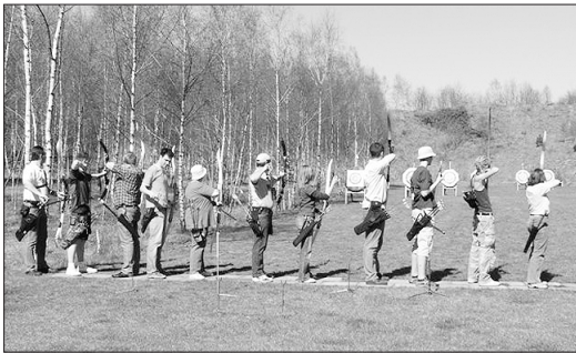
Trainieren jetzt wieder auf ihrem idyllisch gelegenen Platz: Die Bogenschützen des TV Jahn Schneverdingen.