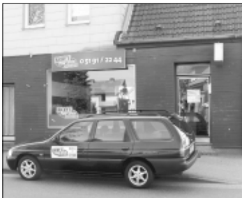
Bei „Ricky's Pizza-Service“ in Soltau gibt es bis zum 15. Mai immer dienstags für Selbstzahler 50 Prozent Rabatt auf alle Speisen.

SOLTAU. Für seine schmackhafte „American Pizza“ und die vielen anderen Leckereien ist „Ricky's Pizza-Service“ bereits seit vielen Jahren bekannt. Vor einigen Monaten ist der beliebte Soltauer Pizzeria-ier in den frisch renovierten Standort die Lüneburger Straße 14 umgezogen. Geliebt ist die gute Qualität: Die reichlich belegten Pizzen in vielen Variationen werden mit frischen Zutaten zubereitet. Auf der Karte finden sich aber auch noch andere schmackhafte Speisen wie