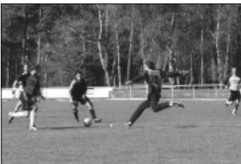
Szene aus dem Spiel SV Soltau gegen TSV Hittfeld: Die Böhmerstädter unterlagen 0:3.

SOLTAU/SCHNEVERDINGEN (vk). Niederlagen kassierten die Fußball-Bezirkligisten SV Soltau und TV Jahn Schneverdingen am vergangenen Wochenende. Die Böhmerstädter unterlagen im Heimspiel dem TSV Hittfeld mit 0:3, die Jahner verloren beim TSV Winsen/Luhe 1:3.