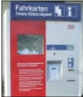
Unbekannte zerstörten das Bedienfeld des Automaten.

MUNSTER. Bisher unbekannte Täter beschädigten auf dem Bahnhof in Munster den Fahrzeugschleppautomaten - jetzt bittet die Polizei um Zeugenhinweise: Die Vandalen zerstörten die etwa 30 mal 22 Zentimeter große Bedienscheibe (Touchscreen) und den dahinter liegenden TFT-Monitor. Die Schadenshöhe beträgt nach Angaben der Polizei rund 1.200 Euro. Der Vorfall muß sich in der Nacht vom 14. auf den 15. April zwischen 18 und 6:20 Uhr ereignet haben. Zeugenhinweise nimmt die Bundespolizeiinspektion in Lüneburg unter Telefon (04131) 872240 entgegen.