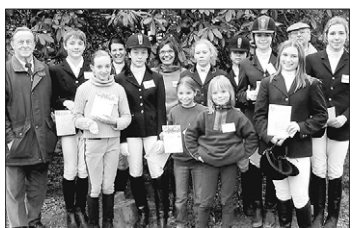
Eine Reitabzeichenprüfung stand jüngst beim RV Alvern auf dem Programm.

ALVERN. Der Reitverein Alvern bemüht sich besonders um die Weiterbildung von Kindern und Jugendlichen und bietet diesen regelmäßig die Möglichkeit, Reitabzeichen zu erwerben. So stellen sich zwölf Teilnehmer jüngst den Prüfungsbedingungen und legten den Basispaß Pferdekunde und das Deutsche Reitabzeichen der Klasse IV und III ab. Zuvor hatten die Ausbilderinnen vom RV Alvern die Prüflinge intensiv vorbereitet. Gefordert waren fundiertes Wissen rund ums Pferd und überzeugende Fähigkeiten beim Reiten.