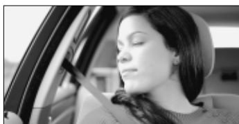
Fahrerassistenzsysteme sind die besten Beifahrer - da können menschliche Beifahrer entspannt schlafen.

Entspannt mit dem Auto ans Ziel kommen - wer möchte das nicht. Doch das stetig wachsende Verkehrsaufkommen erhöht die Unfallgefahr und verlangt von Autofahrern eine immer stärkere Konzentration. Automobilhersteller stellen daher ihre Fahrzeuge zunehmend mit technischen Innovationen, die unter dem Begriff Fahrerassistenzsysteme zusammengefasst werden. Was können diese Systeme leisten, wie funktionieren und was bewirken sie? Antworten auf diese Fragen liefert die bundesweite Informationskampagne des Deutschen Verkehrssicherheitsrates, seiner Mitglieder und Partner. Die Kampagne erfolgt unter dem Titel „Bester Beifahrer“ das Ziel, Informationen über Fahrerassistenzsysteme zu verbreiten, den Zugang an Sicherheit und Komfort sowie die Potenziale in der Unfallprävention be-