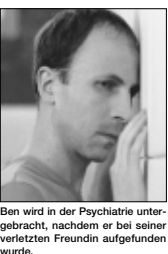
Ben wird in der Psychiatrie untergebracht, nachdem er bei seiner verletzten Freundin aufgefunden wurde.