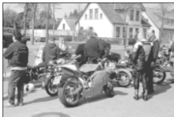
Bei der Gebrauch-Motorrad-Börse dreht sich alles rund ums „Bike“.

WALSRODE. Am kommenden Samstag, dem 21. April, dreht sich bei „M. Schnell Motorradzubehör“ in Walsrode alles um „heiße Maschinen“: In der Hannovererschen Straße 49 erwartet Biker, und alle die es werden wollen, von 10 bis 14 Uhr ein großer Hoffmarkt und der Garten übr ist. Eine Standgebühr oder Eintritt wird nicht erhoben. Für das leibliche Wohl wird ebenfalls gesorgt. Die beiden nächsten Termine in diesem Jahr sind der 30. Juni und der 22. September.