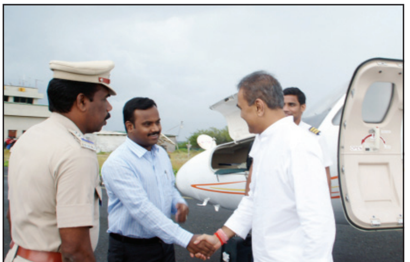
Shri. Ashok Kumar, Collector and Development Commissioner receiving the Hon'ble Minister Shri. Praful Patel at Agatti Airport.

Hon'ble Minister left for Kalpeni Island by helicopter. After the visit at Kalpeni and Kavaratti Island Hon'ble Minister left at 5 PM to Kochi. A large number of gathering including Members of District Panchayat, Village Panchayat, Leaders of the Departments present at Political parties and Head of