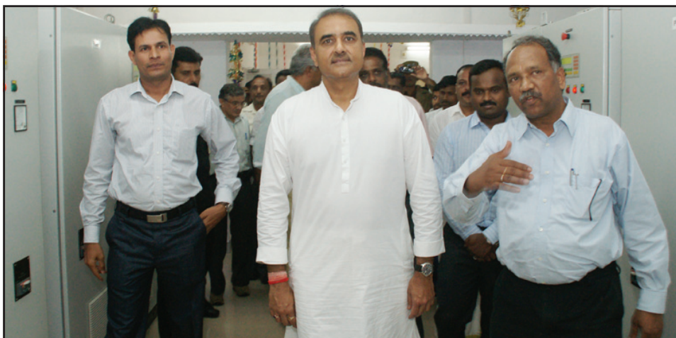
Shri. Praful Patel, Hon'ble Union Minister of Heavy Industries and Public Enterprises and Administrator inspecting the functioning of Solar Power Plant.

A large number of people present to see off the Minister at Helipad.