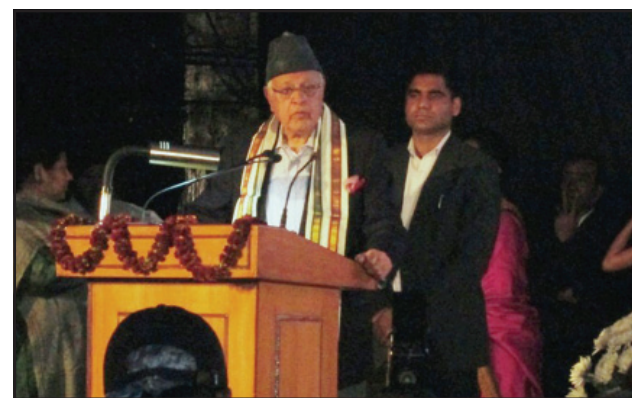
Shri. Farooq Abdullah, Union Minister of New and Renewable Energy addressing the gathering.

New Delhi: The 33 rd India International Trade Fair (IITF), the gala event was concluded with an award