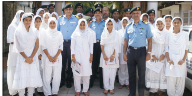
A view of Doctors from Indian Navy along with NCC and NSS Volunteers.

Kavaratti: Indian Navy has conducted Medical Camps in Lakshadweep islands from 25 th to 29 th November 2013. Indian Navy medical team has covered major islands like Minicoy, Kalpeni, Androth and Kavaratti. The team of 26 personnel including specialists in Medicine, Paediatrics, Ophthalmology, Dermatology, Psychiatry, Radiology, Pathology, Dentistry and Paramedical staffs.