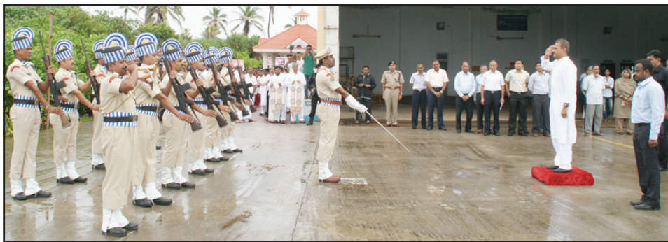
Shri. Praful Patel, Hon'ble Union Minister of Heavy Industries and Public Enterprises receiving guard of honour from India Reserve Battalion at Helipad, Kavaratti.