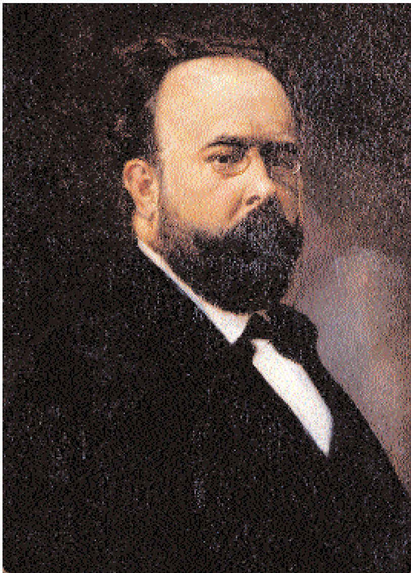
En Teodor Llorente i Olivares (1879-1880)