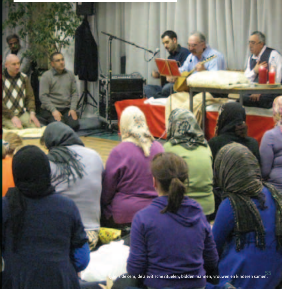
Tijdens de cem, de alevitische rituelen, bidden mannen, vrouwen en kinderen samen.

Een top vijf maken van de religies in Limburg is een moeilijke oefening. Er bestaat geen centraal register van aanhangers. Vanaf wanneer kan je bovendien iemand als 'lid' van een geloofsgemeenschap beschouwen? En hoe deel je de verschillende religies dan in? Toch deed het Provinciaal Integratiecentrum een voorzichtige poging om een aantal cijfers op een rijtje te zetten. De cijfers zijn gebaseerd op de interviews van het Integratiecentrum bij sleutelfiguren van de verschillende religies en op de enquête van Het Belang van Limburg in 2008.