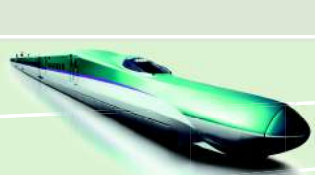
JR北海道 H5系