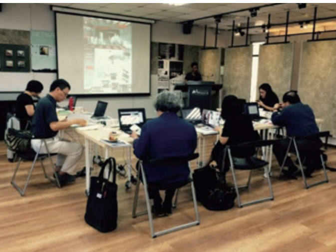
初選讀者入神的風景