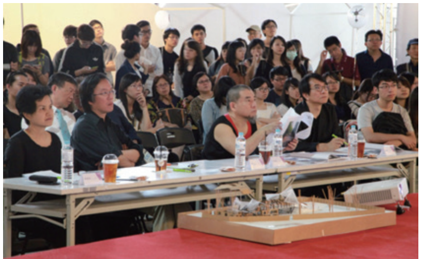
決選讀者醉心的風景

當然還有那些聚集南北，不管是內行看門道或是外行看熱鬧的觀眾們，入戲之深、拍案不絕，這些讀者與觀眾都是這故事精彩的番外又一篇。因為，堅強銳利且忠實不阿的讀者與觀眾在 2015 的夏天，拋下情緒與繁忙，從容地集結一塊，細細地品嚐著一段四百八十六篇耐人尋味的故事。