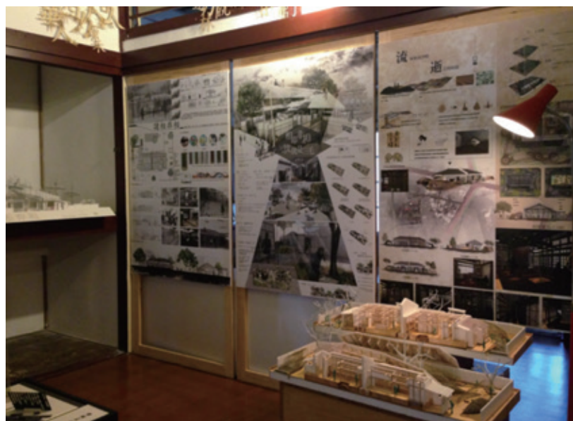
台南321巷藝術聚落展場一景