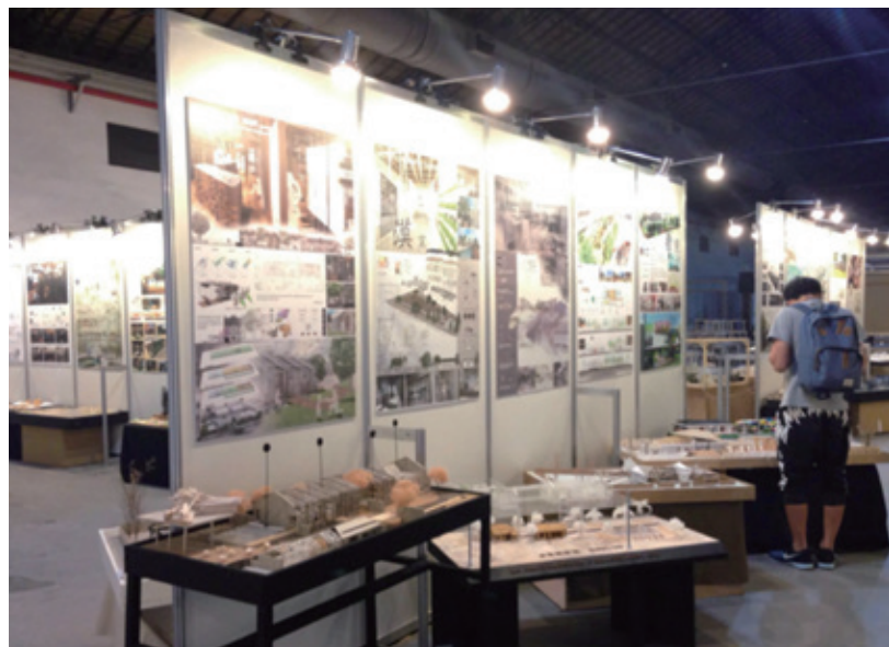
台北松菸文創園區一號倉庫展場一景

正因欲罷卻不能，這些動人且精彩的詩篇又再次於故事最初的場景「321 巷藝術聚落」，展開為期十天的展覽與朗讀，在被文字與歷史圍繞的展示空間中，企圖讓讀者與觀眾再一次思考，故事與詩篇不只是人生中一場或一段的比賽或紀錄，而是如何將統整和創意、設計與文學的活動，融入城市的生活，還有自己的心裡。■