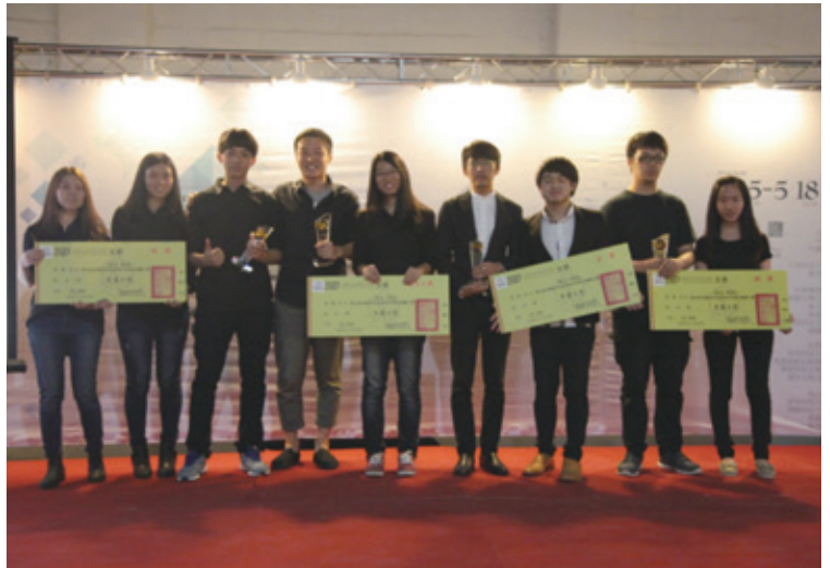
收穫滿滿的故事主角們