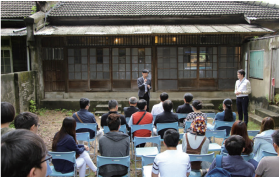
321巷藝術聚落作品展開幕