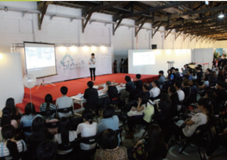
主角導演著自己的故事