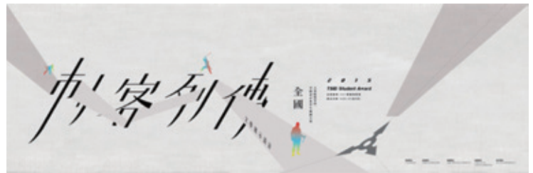
刺客列傳in台南主視覺

明顯地，這動人精彩的故事然已讓讀者醉心於其中。當然，動人的劇本也必須有精彩演繹的故事主角來做完美的詮釋。想當然爾，當初這故事劇本的導演應該也始料未及的慶幸與感動，有這些優秀的主角一同參與這場盛大的演出。