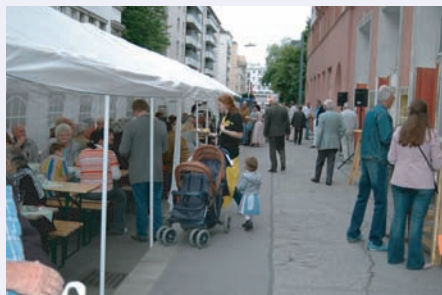
Auch die Plätze in den Partyzelten sind sehr begehrt

Aber nicht nur musikalische Genüsse werden Ihnen geboten, nein - auch kulinarische, der "Kamptaler" kocht bei diesem Fest wieder auf.