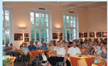
Ausverkauftes Haus im Waldmüllerzentrum

Abschließend noch ein Tipp. Bitte bestellen Sie rechtzeitig Karten, da viele Veranstaltungen oft schon Tage vorher ausverkauft sind !!!