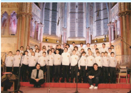
Mozart Knabenchor Wien mit José Cura

im Rahmen der Favoritner Bezirksfestwochen