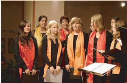
Mitglieder des Chor Curiositas