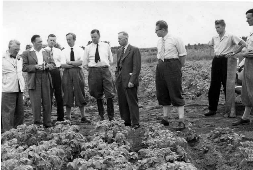
Teori omsatt i praktisk verklighet har alltid varit hushållningssällskapets arbetsmetod. Bilden visar fältförsök med potatis.

bland annat för att tillgodose hyresgästernas växande lokalbehov. Här fanns bland andra Trollhätte kraftverks lokalkontor samt Lantbruksnämnden i Skaraborgs län.