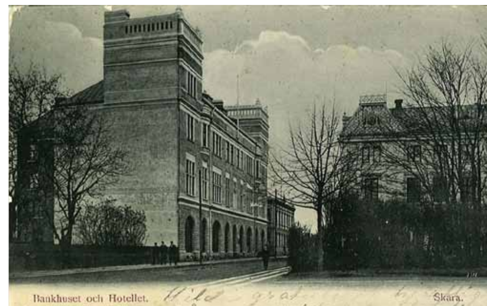
Järnvägsgatan blev under det tidiga 1900-talet bankgata genom Sparbankens expansion.

Regler stadgade storlek på såväl insättningar som uttag. Maximalt insättningsbelopp per gång var 50 riksdaler och högst 200 riksdaler per år och kontot begränsades till högst 2 000 riksdaler. Uttagen var också reglerade – för uttag upp till 30 riksdaler krävdes en månads uppsägning. Högre belopp två månaders uppsägning. Bygdens dominerande näring utgjordes länge av jordbruket vilket även märktes på bankens kundstock. 1880-talet innebar dåliga år för bönderna och om det gick så långt som till exekutiv auktion fick banken själv vid ett antal tillfällen ropa in jordbruksfastigheter. Under depressionsåren på 1930-talet var det snudd på att banken blev ägare till järnvägslinjen Lidköping – Skara – Stenstorp.