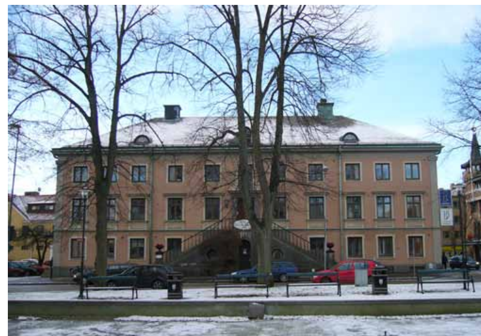
Hushållningssällskapet har varit en viktig aktör i Skara samt Skaraborg allt sedan starten 1807. Sällskapets placering mitt i Skara har starkt medverkat till Skaras livsmedelsprofil.

Skaraborgs läns hushållningssällskap (idag Hushållningssällskapet Skaraborg) bildades i juni år 1807 i Skara. Bland de 40 initiativtagarna fanns landshövdingen, biskopen, domprosten, en hovmarskalk och tre överstar. Syftet var att stärka