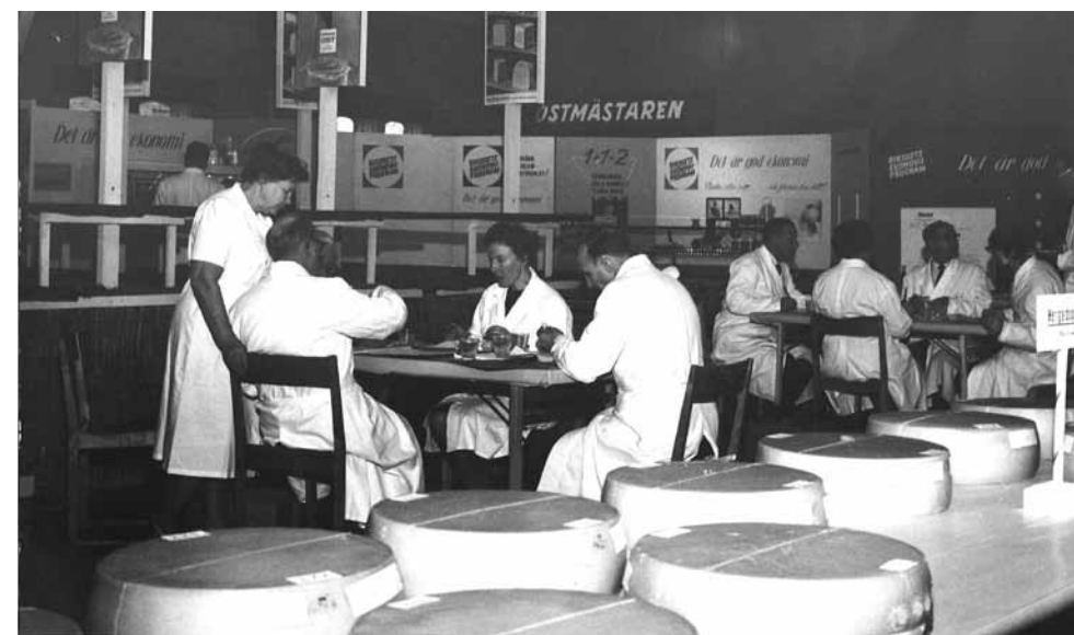
Det som kom att utvecklas till Ostmässan i Skara initierades av hushållnings-sällskapet i mitten av 1800-talet som smör- och ostprovningar. Syftet var under alla år, fram till nedläggningen av mässan 1995, att uppmuntra kvalitetsförbättringar samt sätta fokus på ost som gott och viktigt livsmedel. Mässan hölls under många år i Skaras teaterhus. Bilden visar ostbedömning år 1962. Från och med 1964 hölls Ostmässan i Skara idrottshall.