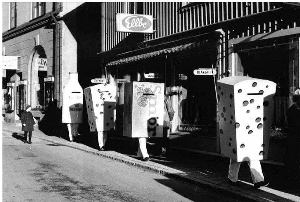
Ostmässan satte sin prägel på Skara med kontor på Skolgatan och vandrande reklampelare i centrala staden under själva mässan. Här Klostergatan.