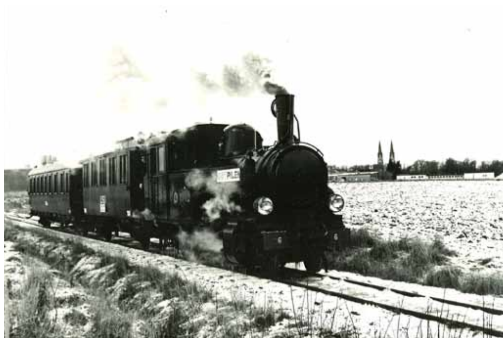
År 1965 fick Ostmässan extra skjuts genom att ångloket Ostpilen började trafikera sträckan Skara järnvägsstation – idrottshallen