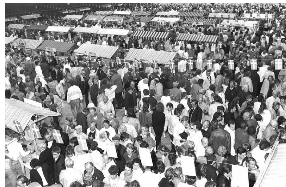
Ostmässan i Skara var en riktig publikmagnet. Allra mest lockade möjligheten att gratis få prova otaliga sorters svensk ost.