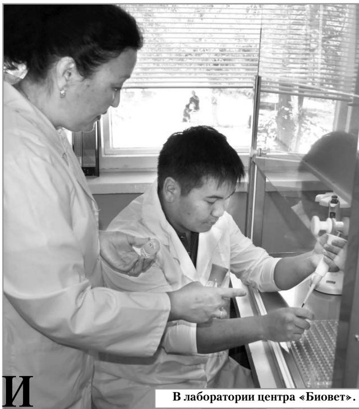
В лаборатории центра «Биовет».

Согласно приказу Министерства сельского хозяйства Калмыкии от 16 мая - об обязательной генетической экспертизе на достоверность происхождения, выявление хромосомных аномалий и определение генетического потенциала продуктивности племенных сельскохозяйственных - работы в этой области отныне будут проводиться на базе учебно-производственного центра биотехнологических исследований и ветеринарных мероприятий КГУ «Биовет».