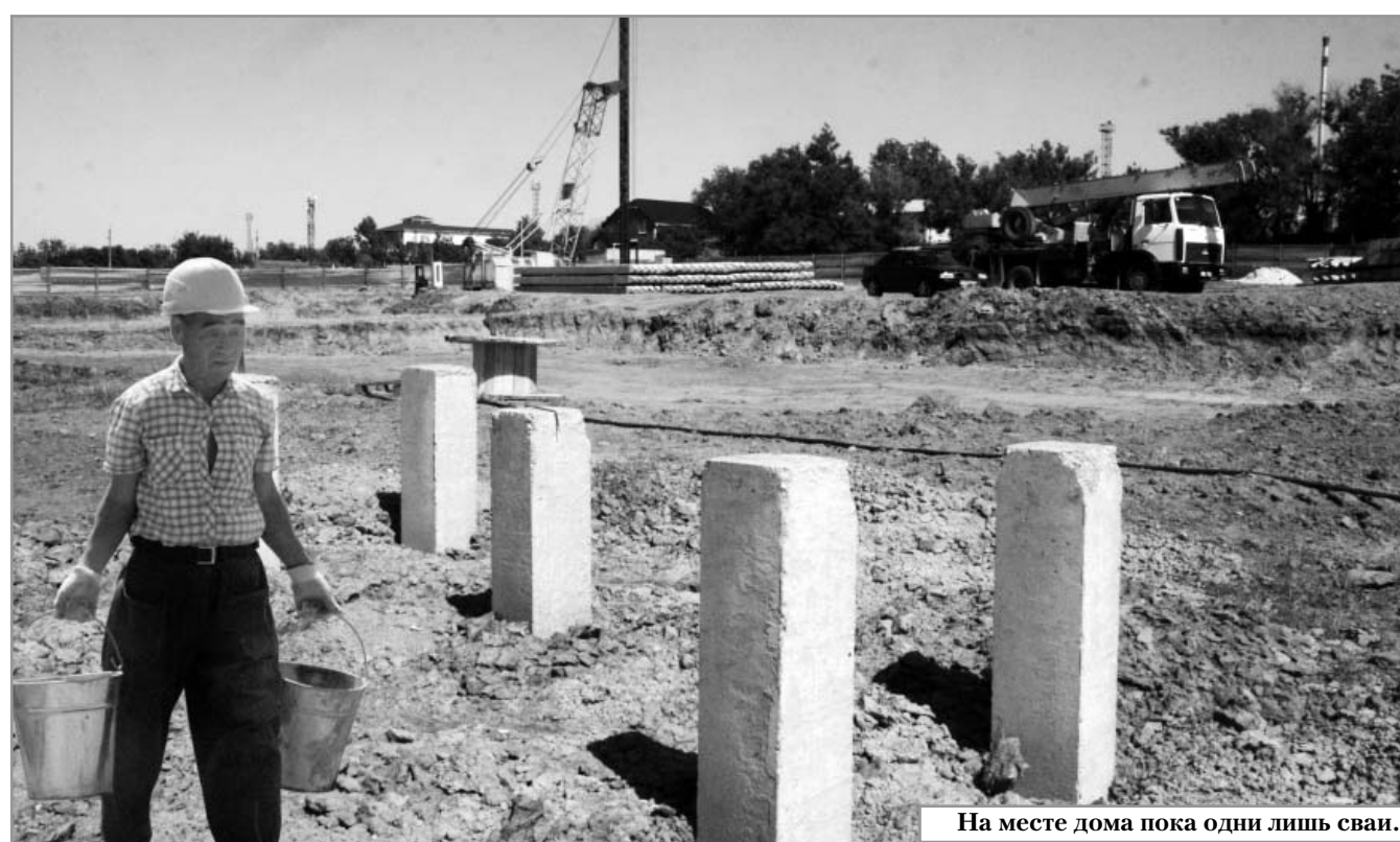
На месте дома пока одни лишь сваи.

Также до указанного срока - декабрь 2012 года - Элиста должна завершить мероприятия по переселению, запланированные на 2011 год. Однако договор подряда на строительство 108-квартирного дома в пятом микрорайоне был заключен столичной управой лишь два месяца назад, в марте. На месте будущего дома начаты работы, недавно появился котлован под фундаментом. В этот дом переселятся, согласно программе, 363 человека, проживающие ныне в 97 квартирах семи ава-