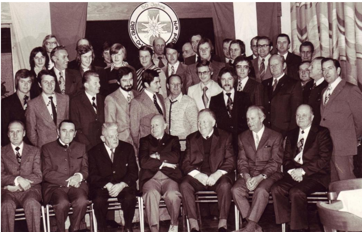
Die Namen der Mitglieder auf diesem Foto finden Sie auf der Homepage der Bergrettung:

Mit der Errichtung der ersten Schleppliftenanlagen in St. Aegydt und am Gscheid in den Jahren 1965 und 1966 hat sich die Anzahl der Bereitschaftsstunden sprunghaft vervielfacht!