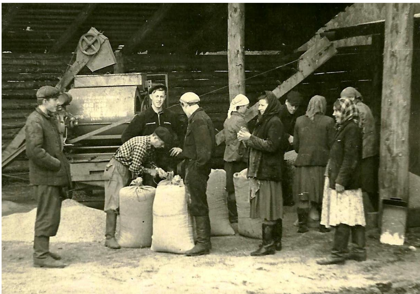
В колхозе «Красный пахарь» на зерносушилке

Совхоз Первомайский в 1967 году переведен в состав Иркутского треста овцеводческих совхозов.