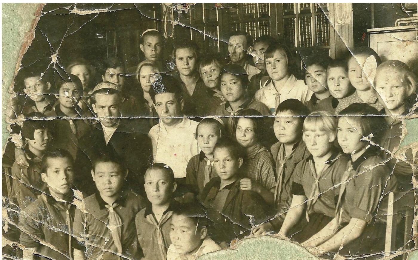
Школьники Новой Уды у наркома просвещения А.С. Бубнова. Москва. 1934 г.

80 лет назад, в феврале 1934 года пришёл ответ от Иосифа Виссарионовича Сталина новоудинским пионерам. Немногим ранее ученики школы по предложе-