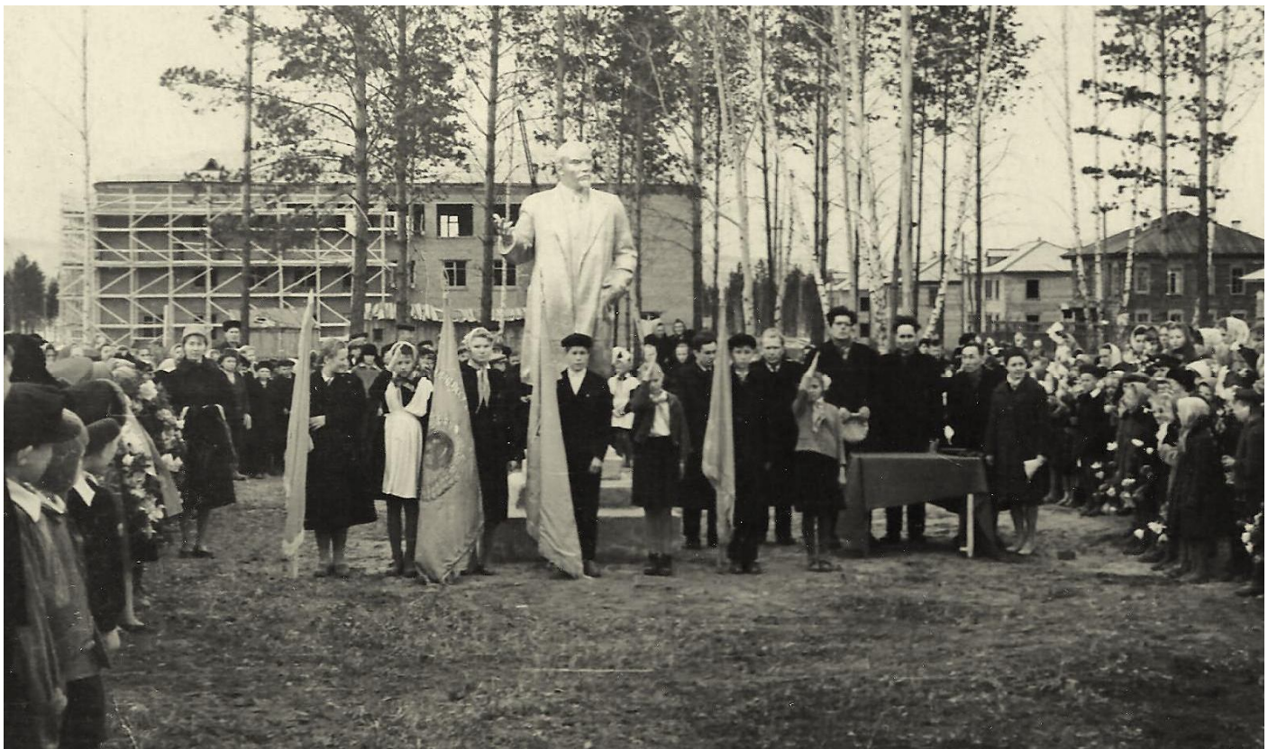
Открытие памятника В.И. Ленину в п. Усть-Уда. Примерно 1963- 64 года