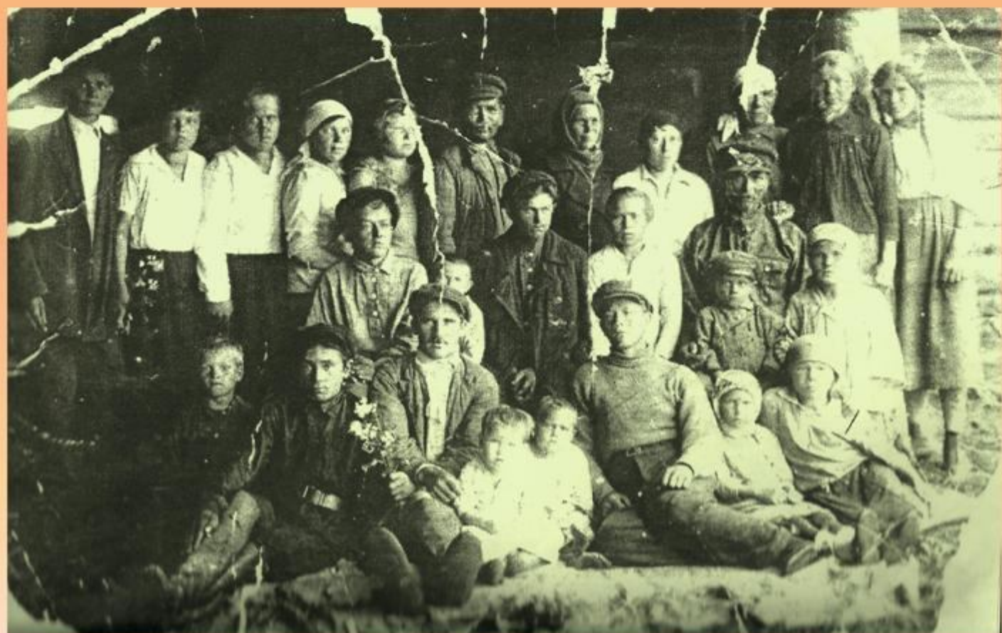
Труженики колхоза «Имени С.М.Кирова», с. Юголок. 1 мая 1945 г.