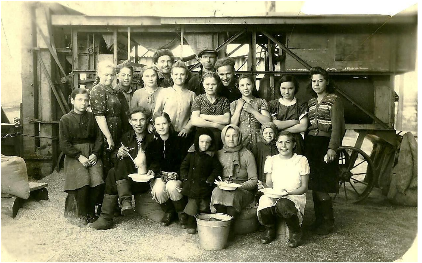
Колхозники колхоза «Имени Чапаева»