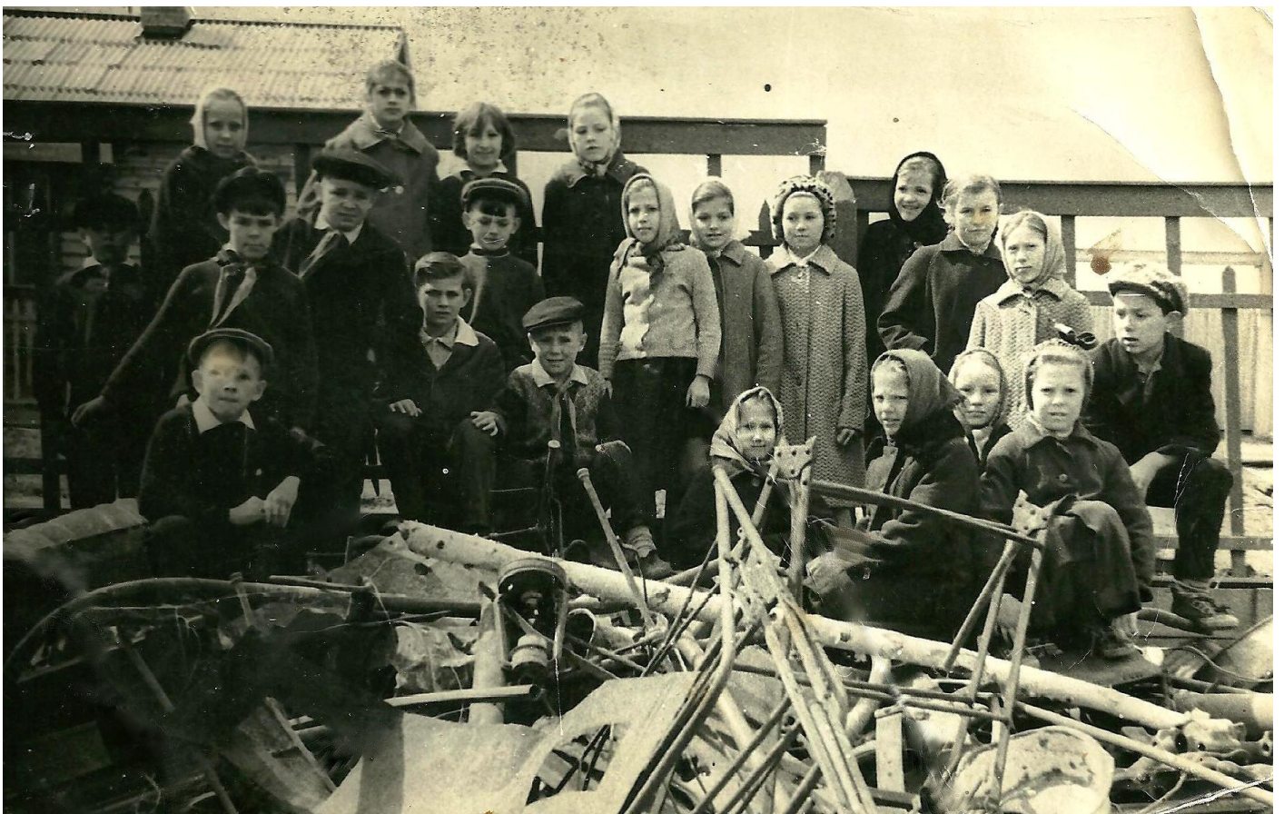
Сбор металла пионерами в с. Юголок

неров. Ежегодно на площади перед Домом Советов возле памятника Ленину производился приём в пионеры.