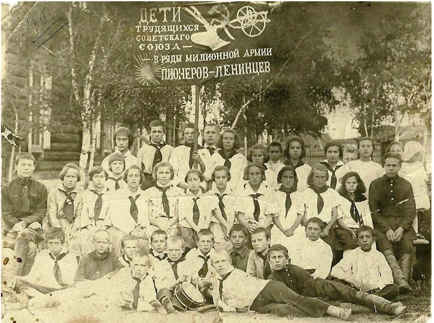
Дети в пионерском лагере в с. Новая Уда. Примерно конец 30-х начало 40-х годов

День Всесоюзной пионерской организации имени В. И. Ленина (День пионерии) — праздник пионерского движения, официально отмечавшийся в СССР 19 мая.