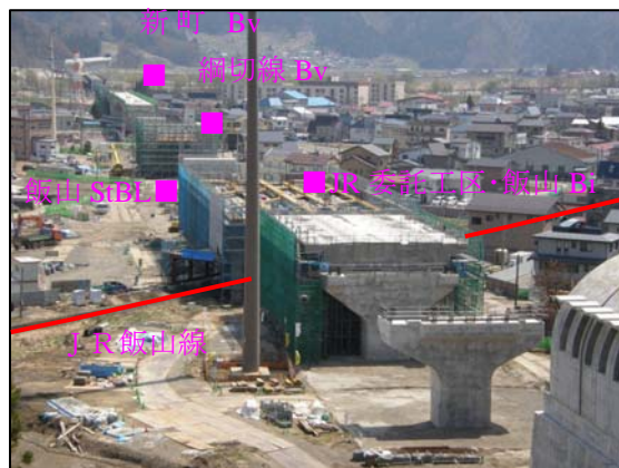
写真-2 舛ノ浦地区より起点方を撮影