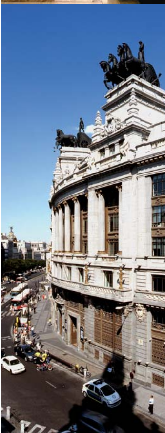
Vistas interiores y exteriores del edificio Alcalá 16.