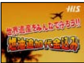
Na:「すべて燃油代込み！」