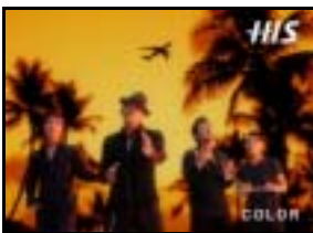
Na:「エイチ・アイ・エスの 新商品は、世界遺産を みんなで守ろう！！」