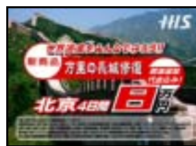
Na:「北京 4日間 8万円！」 「詳しくは店頭またはホーム ページで！」