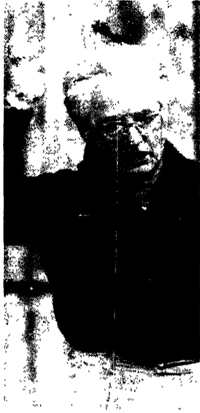
Cossiga secondo Gianfranco D'Angelo