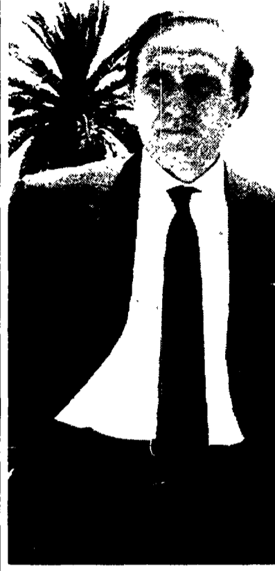
Pippo Baudo all'esordio con «Domenica in»

piacere di più. Invece all'ascolto erano di nuovo in 7 milioni 217mila (appena 17mila meno dell'altro sabato), con il 32,62 per cento di share (lo 0,45 per cento in più). L'Auditel sabato sera è schizzato in giù solo quando sono arrivati Gianfranco D'Angelo (8 milioni e 300 mila) e Gigi Sabani (7 milioni e mezzo); e tutti e due, c'è da aggiungere, erano «in serata». D'Angelo ha avuto la grinta giusta per il monologo (come ai tempi del Drive in) e soprattutto per la sua entrata nei panni del Presidente Cossiga: «Certo sempre di fare bene il mio lavoro - ha scherzato D'Angelo, chiamato anche a sostituire Dorelli al fianco della Carrà - Stavolta ho cercato di fare bene anche il lavoro degli altri». E Dorelli? «Da domani ricominceremo a lavorare insieme - spiega Enrico Vaime, uno degli autori. Anche se sabato non si è fatto trovare... non ce l'abbiamo con lui». [L.S. Gar]