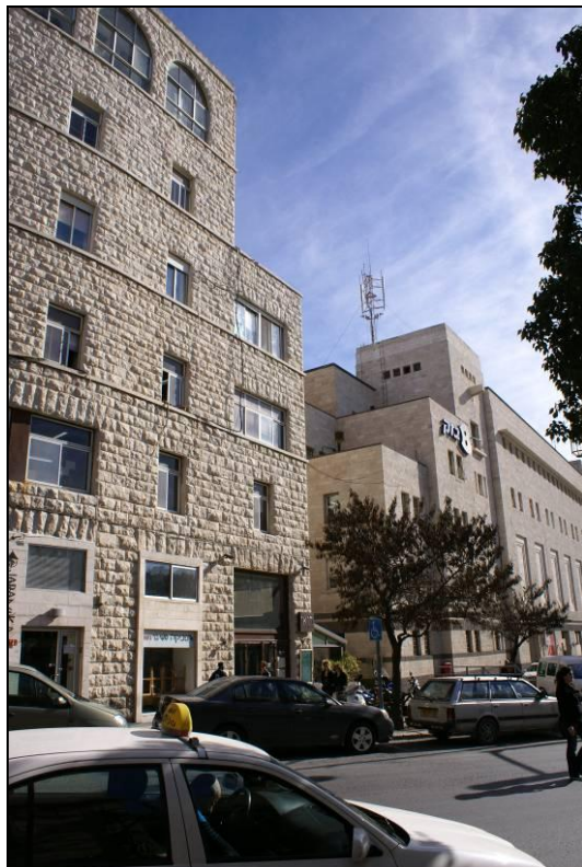
8. חזית דרום מערבית לכיוון רחי' שלומציון