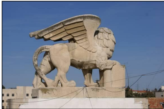
האריה על גג הבניין