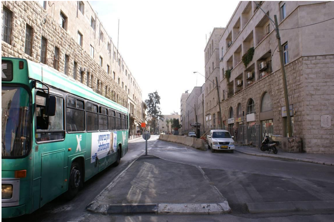
3. חזית צפון מערבית לרחוב יפו