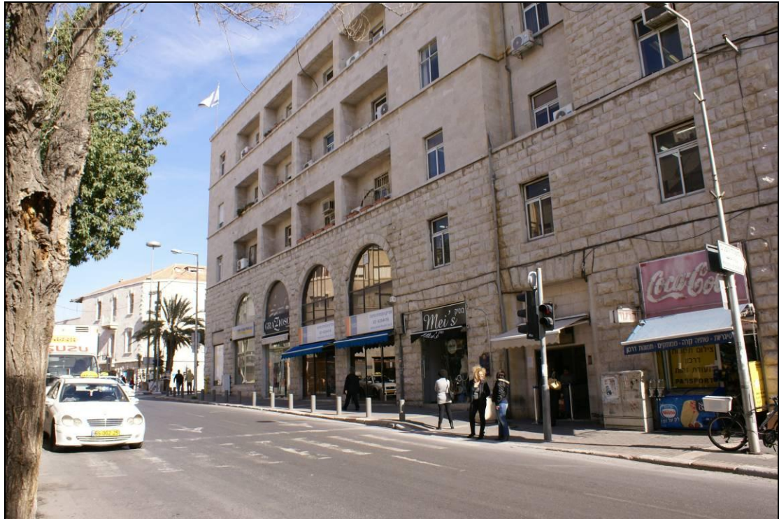
9. חזית דרום מערבית לכיוון רחוב שלומציון.