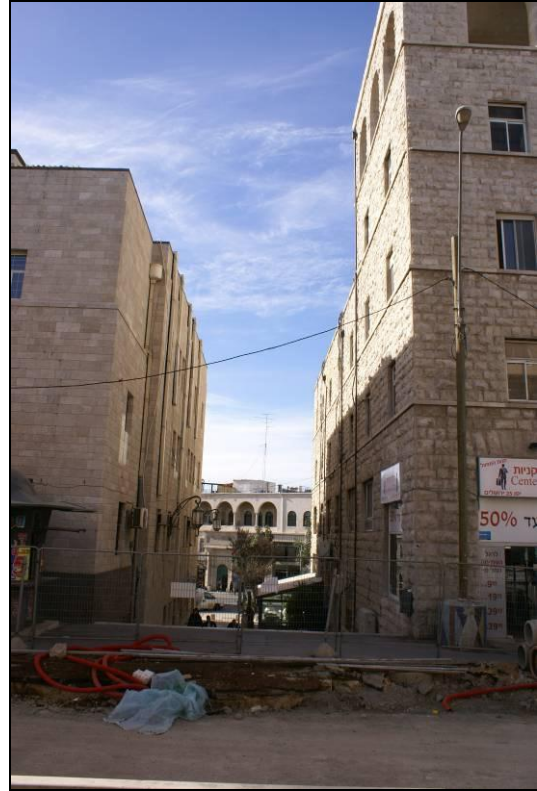
5. חזית מזרחית לכיוון הדואר המרכזי