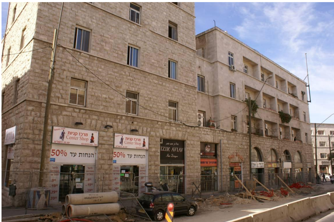
4. חזית צפון מערבית לרחוב יפו