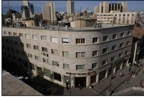
11. מבנה בנק מזרחי בפינת הרח' יפו, שלומציון והסורג.