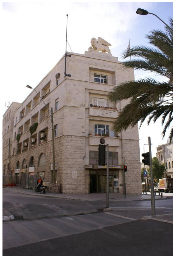
1. חזית צפון מערבית לכיוון התחברות רחוב יפו ושלומציון המלכה.