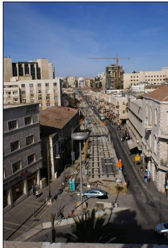
7. מבט מגג הבניין מערבה לכיוון רחי' יפו.