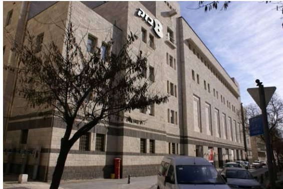
13. בניין הדואר המרכזי רח' כורש.