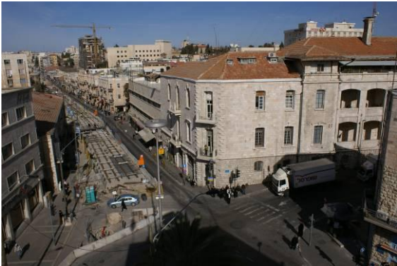
14. בניין מפ"י רח' חשין פינת יפו.