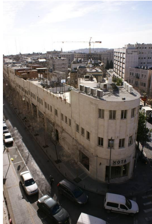
10. פינת שלומציון וכורש.