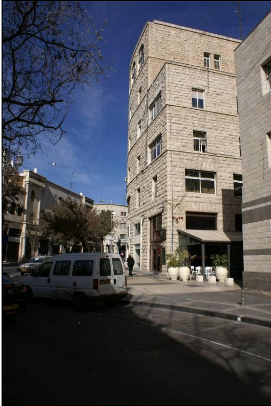
6. צומת הרחי' כורש ושלומציון