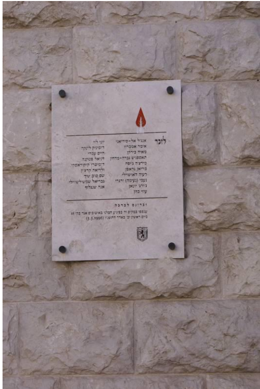
לוח זכרון על חזית הבניין.