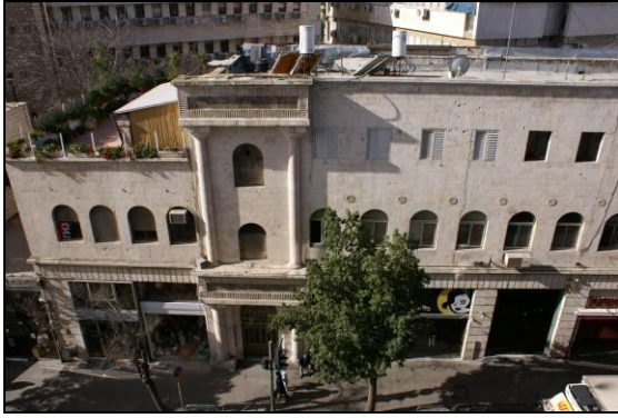
12. מבנה ברח' שלומציון 2, מול הבניין.