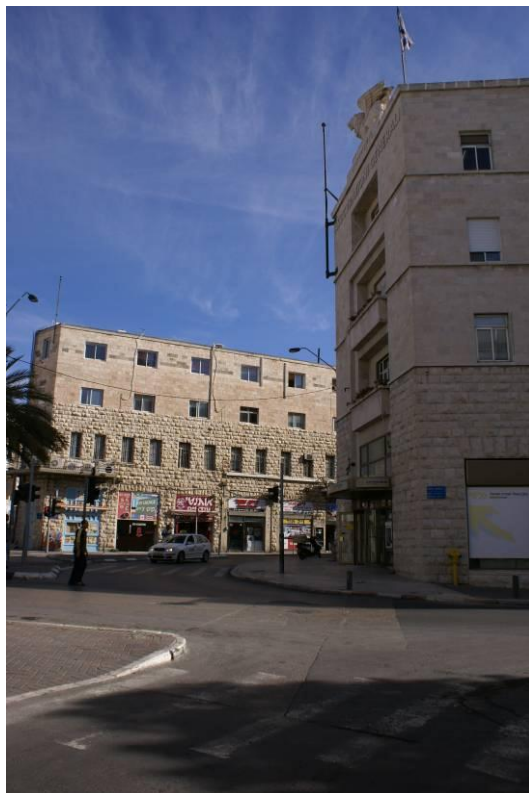
2. חזית צפון מערבית על רקע מבנה מצדו השני של רח' יפו