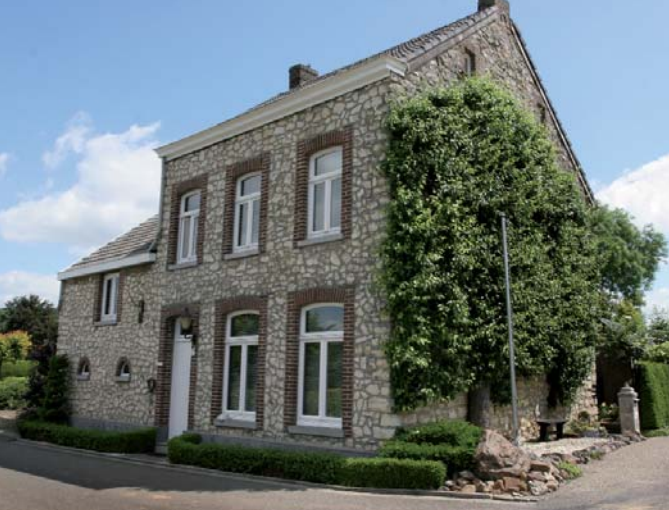
Gevel bedekt met leipeer