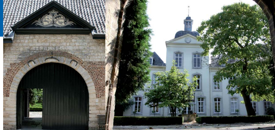
Inrit met driehoekig fronton