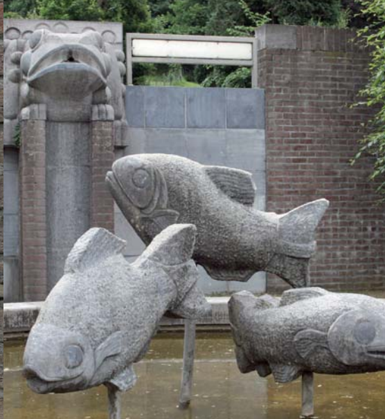
Vroedmeesterpad met vissen