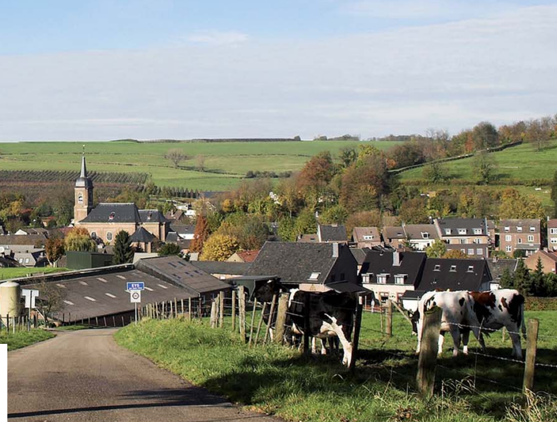
Zicht op Eys

De gemeente Gulpen-Wittern, ook wel het mooiste stukje Nederland genoemd, vormt het kloppend hart van het Limburgse heuvelland. Het reliëfrijke landschap met bossen, weilanden en boomgaarden geven het geheel een groen karakter. Maar ook de vele monumenten, van kastelen en kloosters tot molens en vakwerkboerderijen, zijn beeldbepalend.