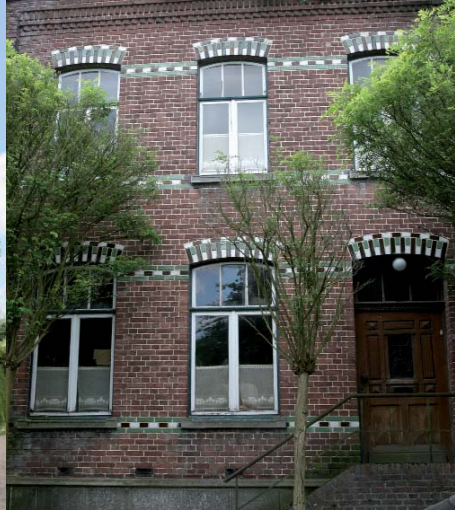
Huis met 'art deco' accenten