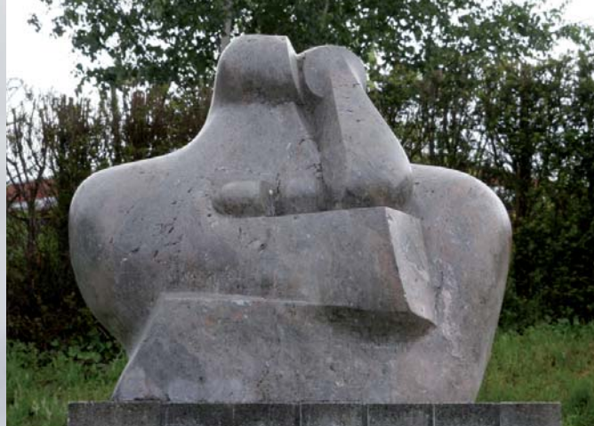
Moeder met kind