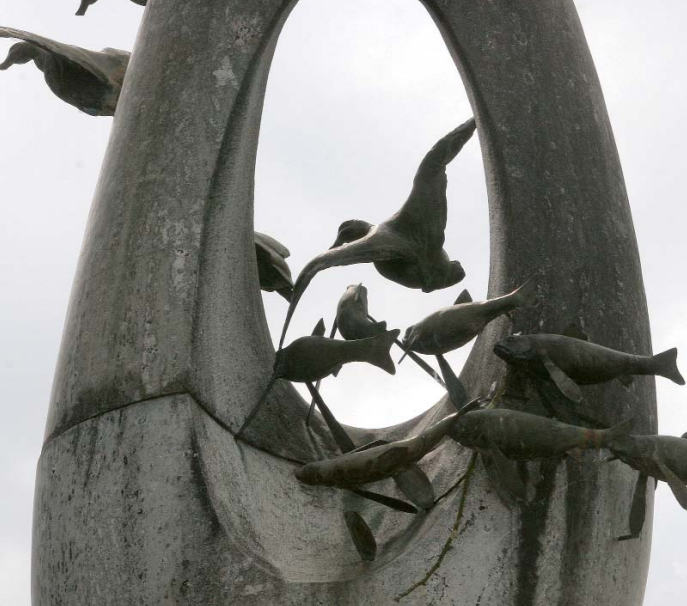
Smeltkroes van de evolutie