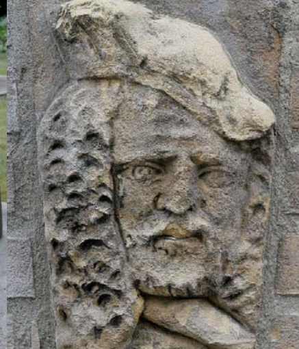
Gezicht van gevel oude school

Kunstenaar > Jef Wishaupt , geboren in Maastricht (1940), woonachtig in Vaals. Het bronzen kunstwerk stelt het gemeentewapen van Gulpen voor en is hier in maart 1989 geplaatst. De vorming en afwerking van het wandreliëf is een compromis tussen het artistieke uitgangspunt van de kunstenaar en de heraldiek, die in het wapen ingesloten zit. Zowel de heraldische kleuren (goud, rood, blauw en zwart) als het gebruikte materiaal (brons) zijn door Wishaupt in hun waarde gelaten.