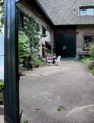
Hof van Holland

Het 'Miljoenenlijntje' dat iets verder naar het oosten in Simpelveld begint, werd in gebruik genomen in 1934. Het was een nieuwe verbinding tussen Simpelveld en Kerkrade om de voormalige Domaniale kolenmijn op het landelijke spoorwegnet aan te sluiten. De aanlegkosten van het circa twaalf kilometer lange traject bedroegen één miljoen gulden per kilometer, vandaar de naam. Sinds 1995 rijdt op het traject tussen Schin op Geul en Kerkrade een toeristische stoomtrein van de Zuid-Limburgse Stoomtrein Maatschappij (ZLSM).