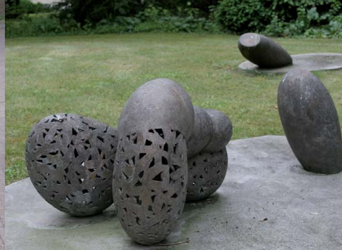
De Worsteling van Jakob