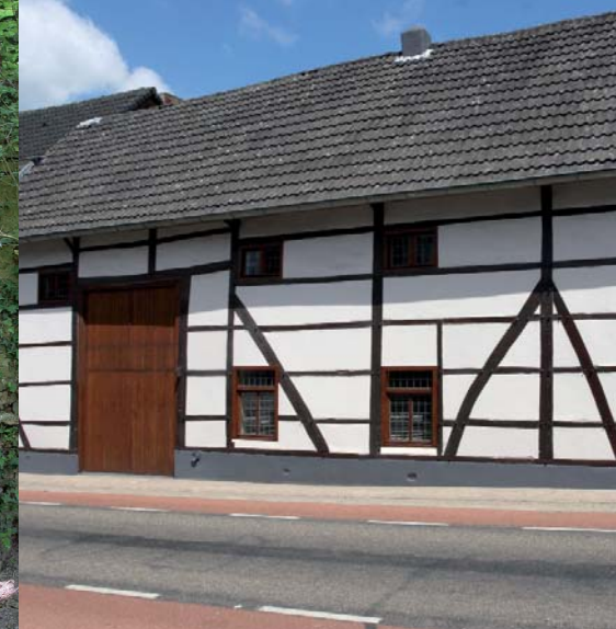
Vakwerkhuis met glas in lood ramen

St. Agathastraat nr. 17 is weer een woning in Kunradersteen. De omlijstingen van ramen en deur zijn van Naamse steen. De toprand van de zijgevel is hersteld, niet in Kunrader-, maar met de zachtere Maastrichtse mergelsteen. Dit is goed te zien aan de gladde, geschaafde afwerking van deze steen.