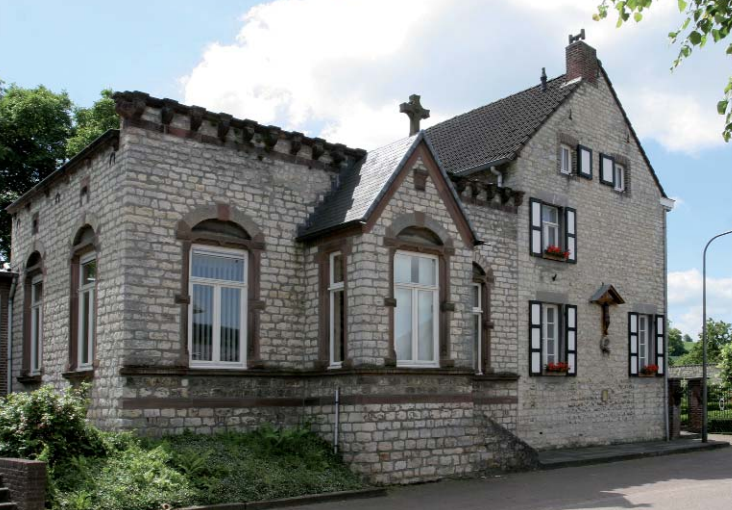
Patronaatsgebouw en pastorie