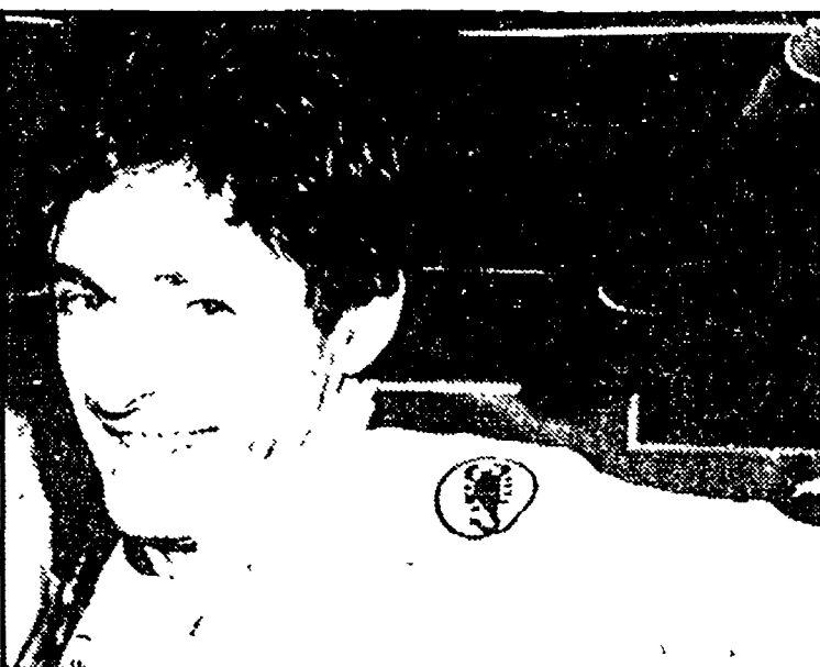
● FRANCESCO MOSER

liti collegi con menù fisso, secondo le disposizioni di Goddet e Leuitan.