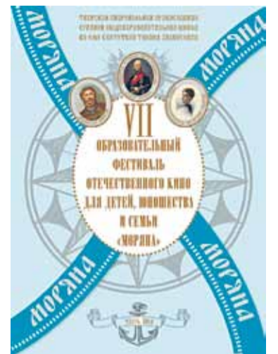
Афиша фестиваля «Моряна»

В рамках программы в июне прошлого года удалось провести исследовательскую экспедицию – пеше-водный крестный ход по местам древних поселений православных христиан в Тверской области (Вы-