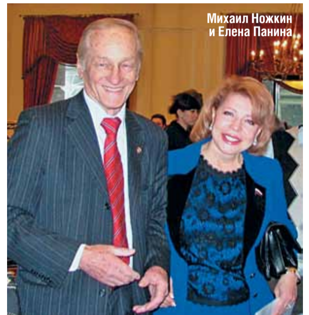
Михаил Ножкин и Елена Панина