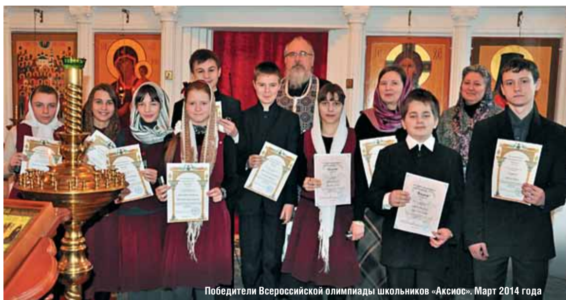
Победители Всероссийской олимпиады школьников «Аксиос». Март 2014 года

с истинно прекрасной православной культурой, отблеском красоты Божьего мира.