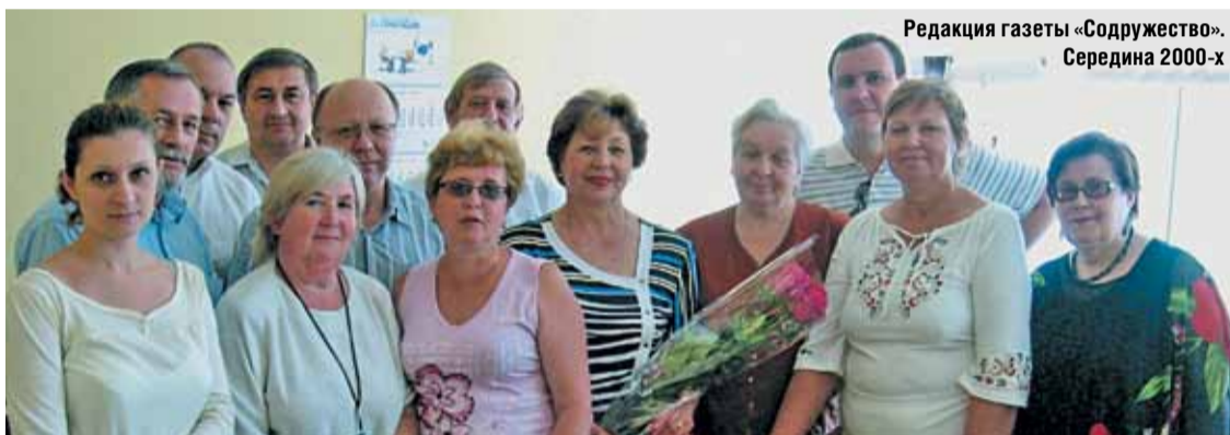
Редакция газеты «Содружество». Середина 2000-х

Журналисты и руководители проектов все эти годы активно участвовали в городских мероприятиях, в работе Конфедерации – профессионально освещали проблемы и перспективы науки и промышленности, социальную сферу. Работая под известным девизом: «Ни дня без строчки!», мы ежегодно неоднократно награждались дипломами и благодарностями Российского союза промышленников и предпринимателей, Торгово-промышленных палат РФ и Москвы, Правительства Москвы, многих престижных международных и всероссийских форумов и выставок, информационным спонсором которых мы являемся и сегодня.