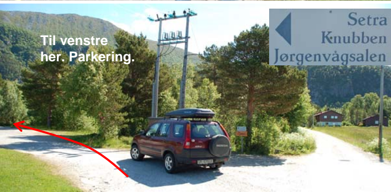
Til venstre her. Parkering.