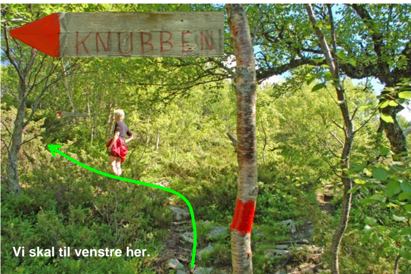
Vi skal til venstre her.

I bjørkeskogen får vi et stidele. Vi skal til venstre mot Klubben som skiltet viser (bildet til høyre). Snart er vi over skogen. Stien svinger nå mot venstre, mot toppen (bildet til høyre). God sti helt opp. Retur samme vei.