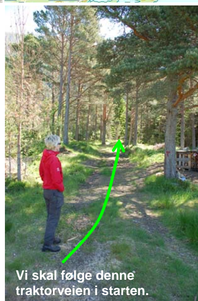
Vi skal følge denne traktorveien i starten.

Stien tar en sving slik som vist på bildet over. Følg skilt mot Setra (en utsiktsplass vi skal opp til), gjennom to grind og tilbake til en traktorvei bak huset (bildet opp til høyre). Følg T-merkene og traktorveien. Den går over til sti lenger framme. Der denne deler seg, går vi mot høyre og krysser en liten bekk. Stien går nå bratt oppover lia. Vi går gjennom nok ei grind (bildet opp til høyre). Etter en knapp times gange flater terrenget ut (bildet til høyre).