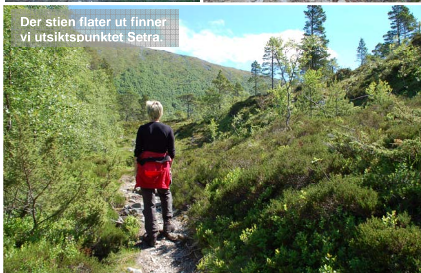
Der stien flater ut finner vi utsiktspunktet Setra.