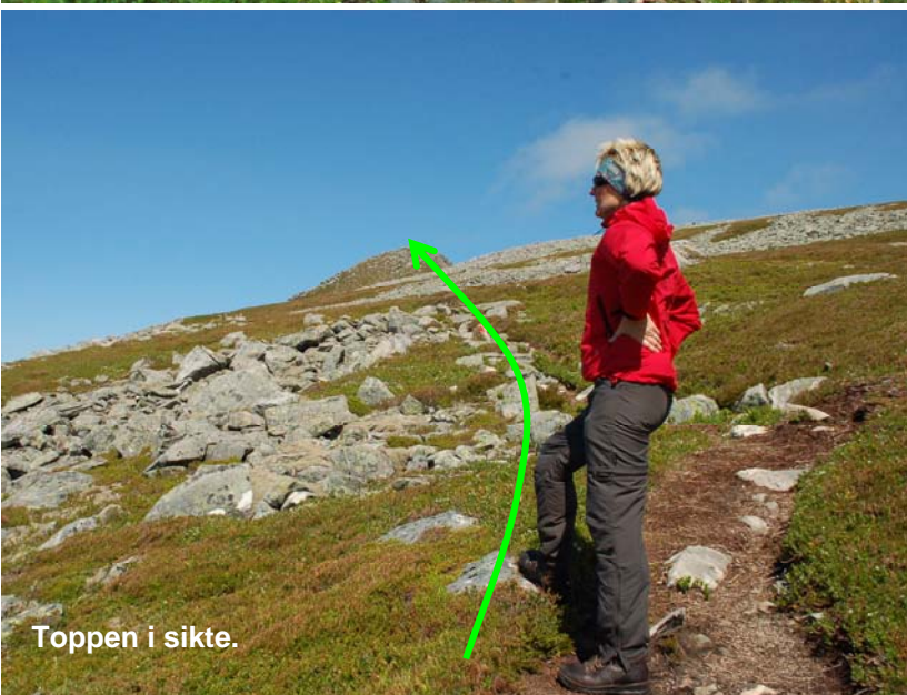
Toppen i sikte.

På vei tilbake kan du ta ned fra Vakta, slik som vist på bildet. Følger du ryggen mot nordvest vil du finne en svak sti. Denne krysser den lille dalen omtrent ved spissen på pilen og kommer så tilbake til hovedstien på punktet på bildet opp til høyre.