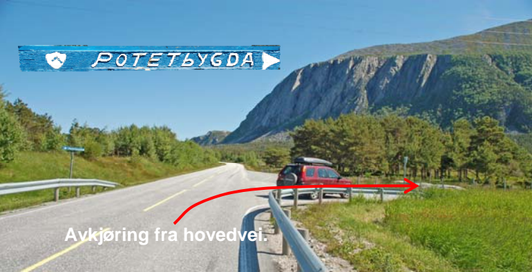
Avkjøring fra hovedvei.