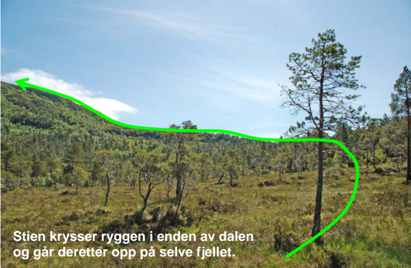
Stien krysser ryggen i enden av dalen og går deretter opp på selve fjellet.

Vi er ved utsikts- plassen Setra (bildet over). Her står det skiltet mot Jørgenvågsalen og Klubben. Stien går innover myrene mot høyre som vist på bildet øverst til høyre. Vi skal gå i høyre kant av denne dalen og så krysse over til venstre. Her går vi midt på ryggen i enden av dalen, som vist på bildet. I starten skal vi over noen små myrer, men stien blir tørrere på ryggen. Fra der vi starter på selve fjellet har vi tørr sti videre.