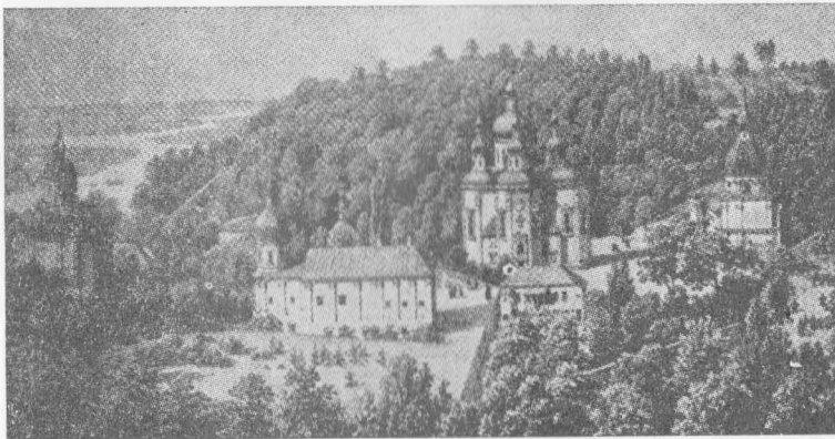
Видубецький монастир у Києві ( Лужн. , стор. 8)