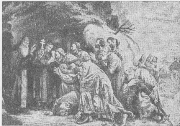
Ізяслав I відвідує печерських ченців ( Лужн. , ст. 61)

(76) Ці біографічні вістки дещо розходяться з тим, що сказано в Літонисі під роком 1051-им. Спроби поєднати ці суперечності мало кого вдоволяють (див. Д. Абрамович, Исследования... , стор. XVIII-XX; М. Грушевський, Ист. укр. літерат. , том 2, стор. 84).