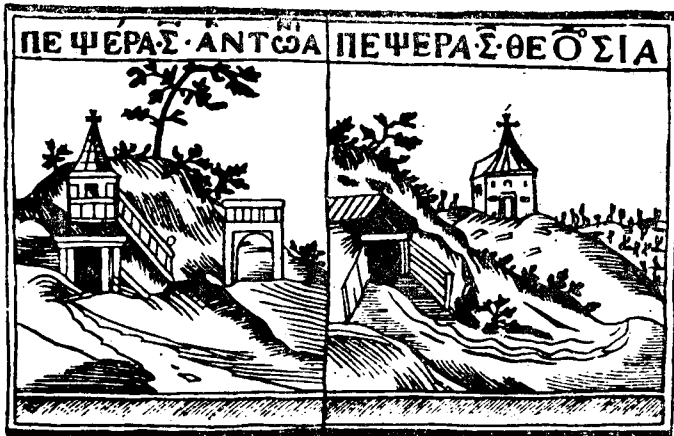
Печери Антонія і Теодосія: з « Бесід св. Золот. », Київ 1623

(32) Тут не обов'язково розуміти « Життя » Теодосія, але можна приймати і літописне оповідання під роком 1074-им.