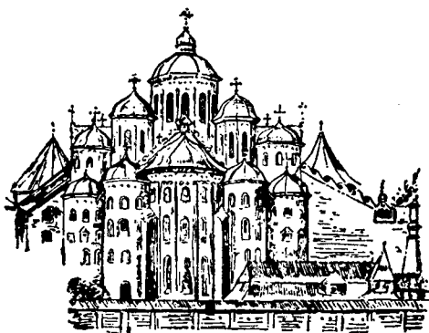
Київська Софія: сх. фасад (ЕУ, 2, стор. 802).

В 1182-му р. поставлений архимандритом Василій (190).