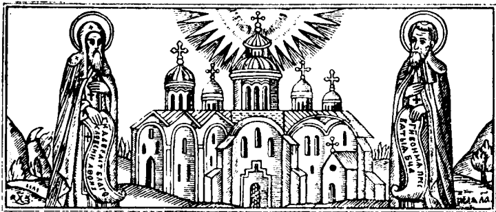
Св. Антоній і Теодосій: заставка «Патерика» XVII ст.

Знаючи твоє добросердя, я поважився відкрити мої уста на твою похвалу, не щоб принести тобі достойну хвалу, але щоб знайти собі в тебе, Отче, успіх і полегшу моїм гріхам і на всяке зберігання й неспосильні повчання. Бо прославили тебе небесні сили і прийняли тебе апостоли, зберегли тебе пророки, обняли тебе мученики, співрадіють з тобою святителі, зустріли тебе хори ченців, возвеличила тебе й сама небесна пречиста Цариця, Мати Господня, і дуже вивищила тебе й учинила знаним до краю землі, вірний слуго Христовий! А я, як можу тебе достойно похвалити, маючи скверні уста і нечистий язик? Та немаючи нічого, щоб принести тобі в день твого відходу, хіба лиш оцю малу похвалу, немов маленький і смердючий потічок, протікаючий у морських просторах, не щоб наповнити море, але щоб очиститися з бруду. Тому, чесна голово, святий Отче, преподобний Теодосіє, не прогнівайся на мене грішного, але помолися за мене, твого грішного слугу, щоб Господь наш Ісус Христос не осудив мене в день свого приходу, бо Йому достоїть слава з безначальним його Отцем і з пресвятим, і благим, і животворним Духом, нині й повсякчас. Амінь.