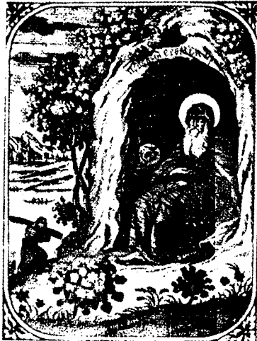
Преп. Єремія: ілюстрація « Патерика » 1702 р. ( Заласко , ст. 175)