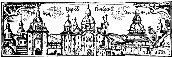
Печерська Лавра, XVII ст. (Лузницький, ст. 296)