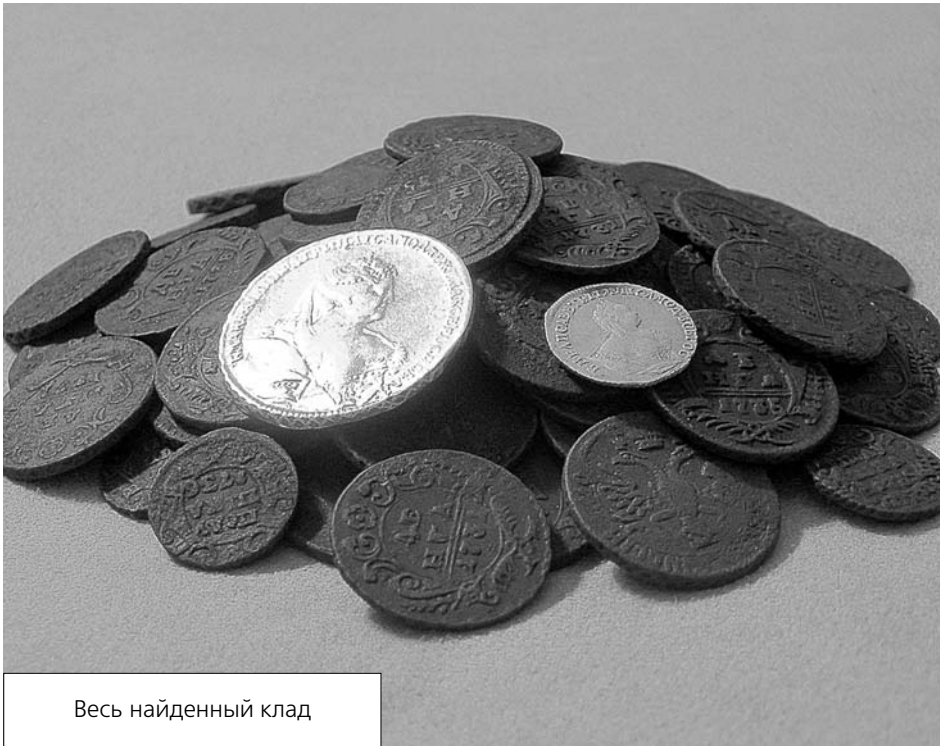
Весь найденный клад

оказалась полушкой), имели приличную сохранность и годами выпуска укладывались в небольшой период. Никаких находок, кроме монет, в этом месте не было.