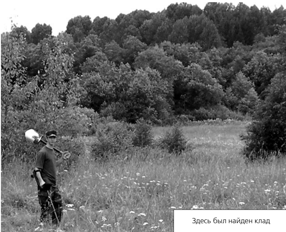
Здесь был найден клад

Обкосив все вокруг в радиусе пяти метров, я продолжил поиск монет. Пятая, шестая, восьмая... двадцатая. Все монеты были одного номинала (только одна