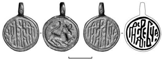
Прикладная шейная печать конца 15 - 16 в. из деревни Кстинино

Найденная печать, судя по ее датировке, принадлежала кому-то из обитателей Кстинина, проживавшего в деревне в первый период ее существования, еще до того, как она на некоторое время стала пустошью.