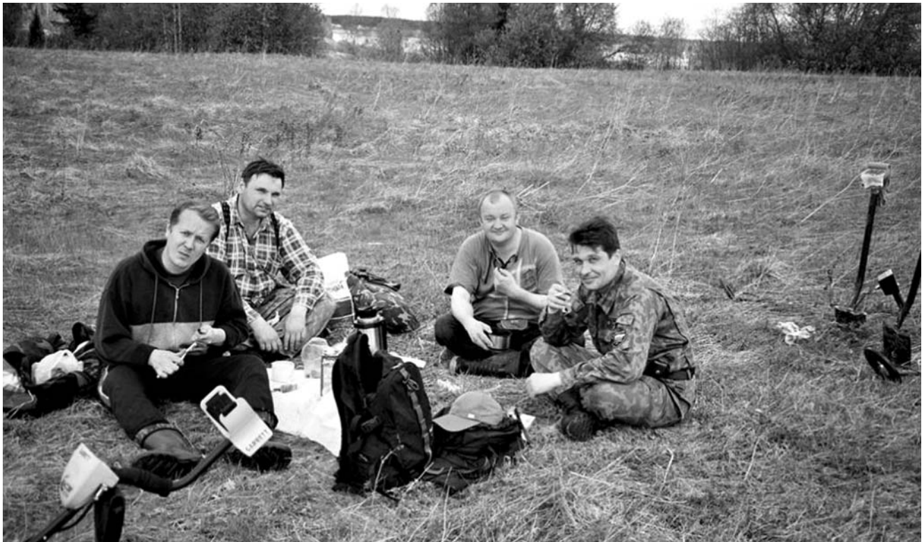
Ничто не может остановить настоящего копателя! Архангельская "бригада"

Милиция уехала, но настроение было испорчено надолго и всерьез. Не помогли ни выпитая бутылка коньяка, ни доеденные бутерброды. Помотавшись по дальним пустым полям, поматюгавшись (прости, жена товарища, ведь такой день пропал!), поехали домой. И через некоторое время приняли эпохальное решение: ДОГОВОРИТЬСЯ С ПРЕДСЕДАТЕЛЕМ . Ничто не может остановить настоящего копателя! Ни погода, ни милиция, ни административный ресурс. Держись, КАБАК! Что из этого получилось (а ведь получилось!) - отдельная история.