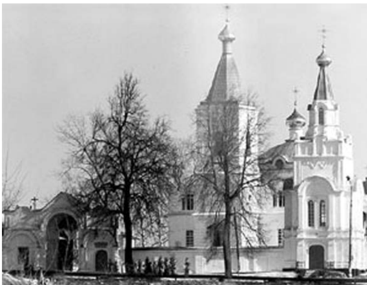
Спасо-Преображенский монастырь в Рославле.

Не исключено, что никакого клада и не было, а какую-то часть ценностей настоятель успел передать верным людям, которые после падения безбожной власти должны были возвратить в монастырь хранимое. Но возрождение монастыря началось лишь в 1996 г. 28 декабря этого года на заседании Священного Синода Русской Православной Церкви было принято решение о возобновлении монастыря в городе Рославле Смоленской области. Настоятелем был назначен игумен Сергей (Зятков).