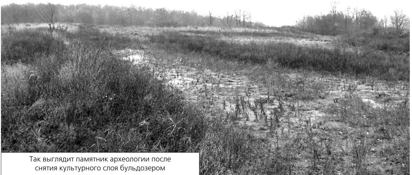
Так выглядит памятник археологии после снятия культурного слоя бульдозером