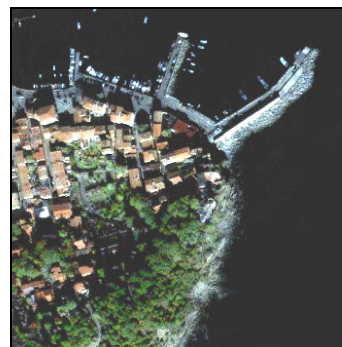
foto aerea dell'area