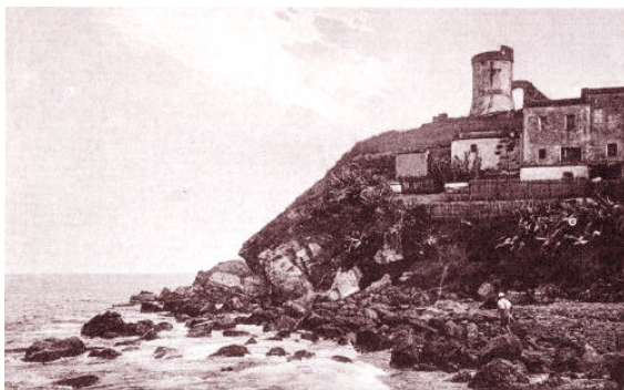
Marina di Campo - La Torre