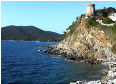
La torre oggi