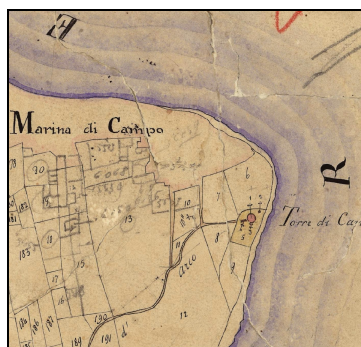
Inquadramento storico su Catasto Leopoldino

Attorno a questa torre d'avvistamento, iniziarono in tempi relativamente recenti i primi insediamenti, ma soprattutto intorno alla chiesetta di San Gaetano, cappellania dei sudditi del Re di Napoli e dell'antioro Corona di Spagna. Qui, come altrove, presidiavano i luoghi strategici dell'Elba, in una lunghissima lotta per la supremazia sul Mediterraneo contro i Francesi, i quali, d'altro canto, si alleavano con i pirati barbareschi di fede musulmana, per controbattere lo strapotere della monarchia di Carlo V e di Filippo II.