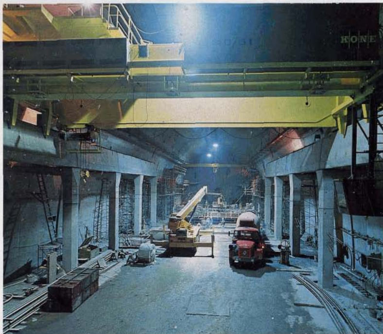
Caverna de máquinas Colbún

Las aguas utilizadas serán entregadas a un sistema de túnel y canal de 2.700 m de longitud que las conducirá hasta el embalse Machicura.