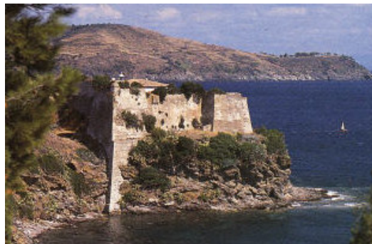
Il forte oggi