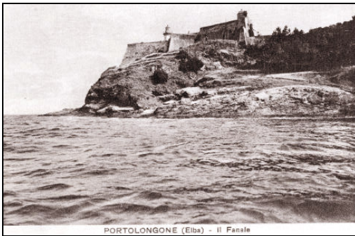
il forte in cartoline d'epoca