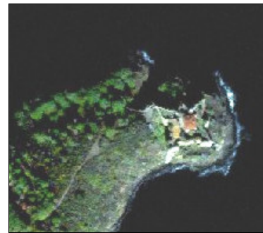
foto aerea dell'area