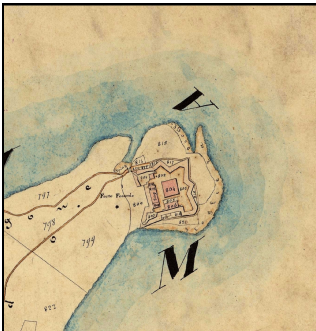
Inquadramento storico su Catasto Leopoldino

espansione della nuova corona partenopea ed a completamento del sistema difensivo che aveva il suo baluardo centrale in forte S. Giacomo, ad ulteriore guardia del mare prospiciente Portolongone. La fortificazione presenta una pianta quadrangolare bastionata. Dotata originariamente di un fossato sul fronte di terra, presenta, dalla parte del mare, i bastioni a scarpa che scendono a picco per oltre trenta metri. Il forte poteva alloggiare una guarnigione di circa cinquanta soldati.