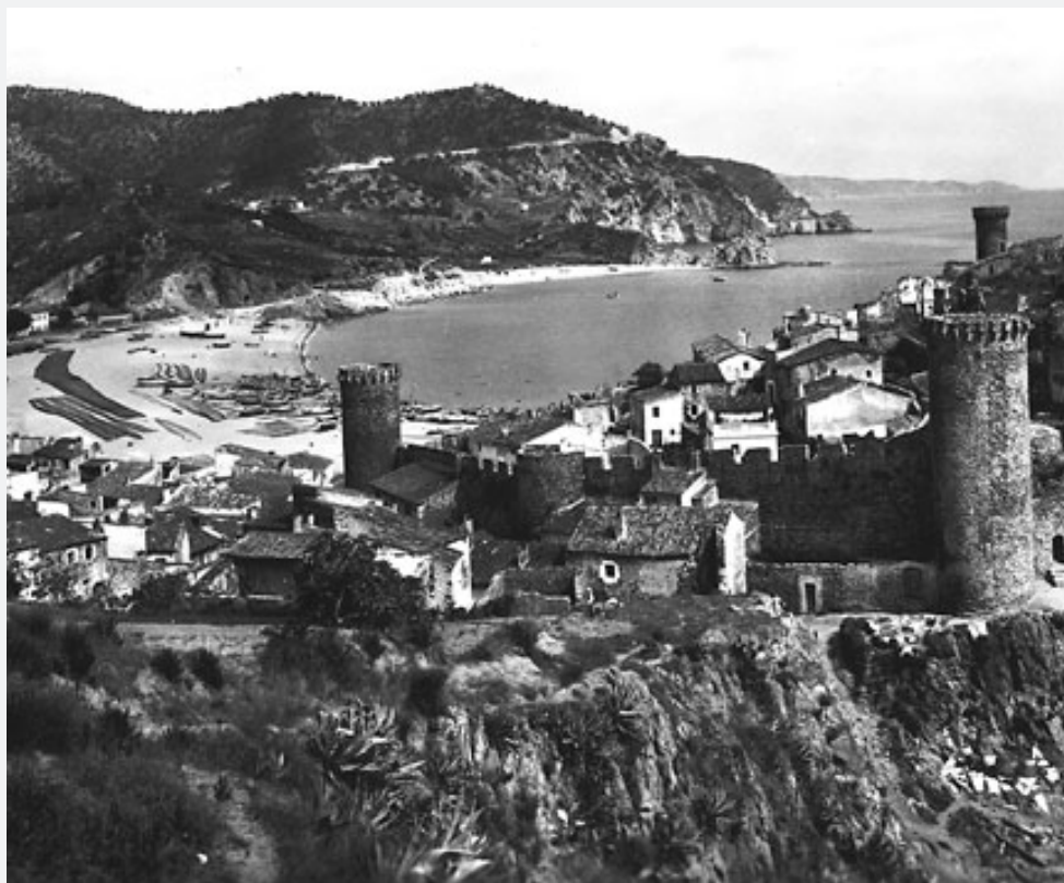
1928-1938. La Costa Brava comença a atraure alguns artistes, com Marc Chagall, que s'instal·la a Tossa de Mar.