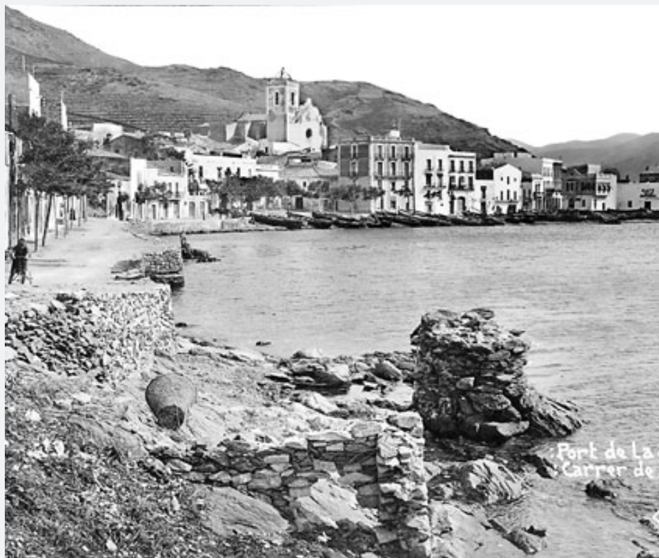
1908-1918. A la costa es vivia sobretot de la pesca. La foto és del Port de la Selva, entre 1911 i 1915.