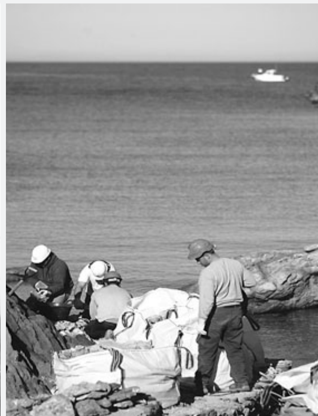
1998-2008. Cal nou model turístic més sostenible, que recuperi el valor del paisatge. El 1998 el cap de Creus és declarat parc natural. El 2005 es tira a terra l'edifici Fluvianàutic, a Sant Pere Pescador, un símbol de l'especulació urbanística al litoral (a la foto de l'esquerra) i el 2007 es comença a enderrocar el Club Mediterrané.