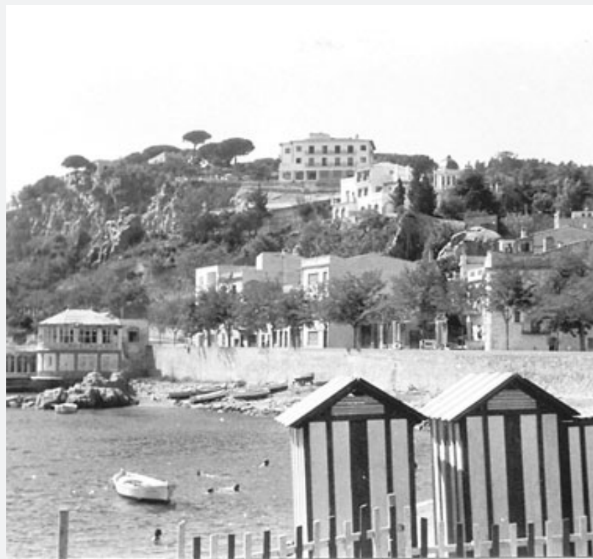
1918-1928. Comença tímidament el turisme. Els banys de Sant Elm, a Sant Feliu de Guíxols, es van construir el 1922.