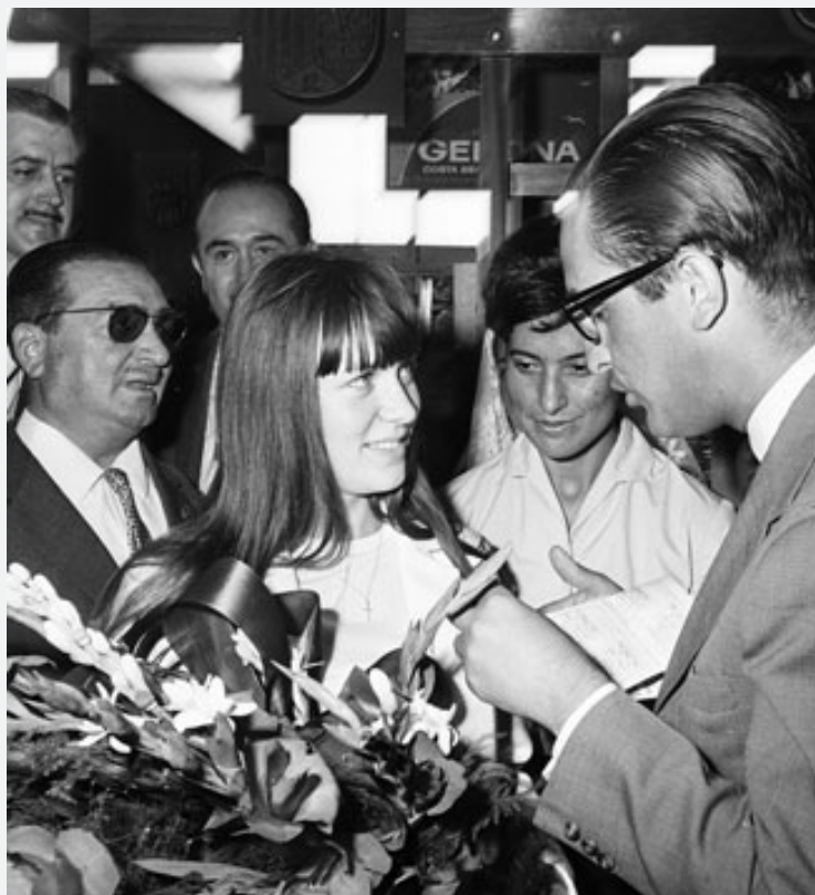
1858-1968. L'inici del boom. A la foto, la turista 11 milions a l'aeroport de Girona, l'agost del 1967.