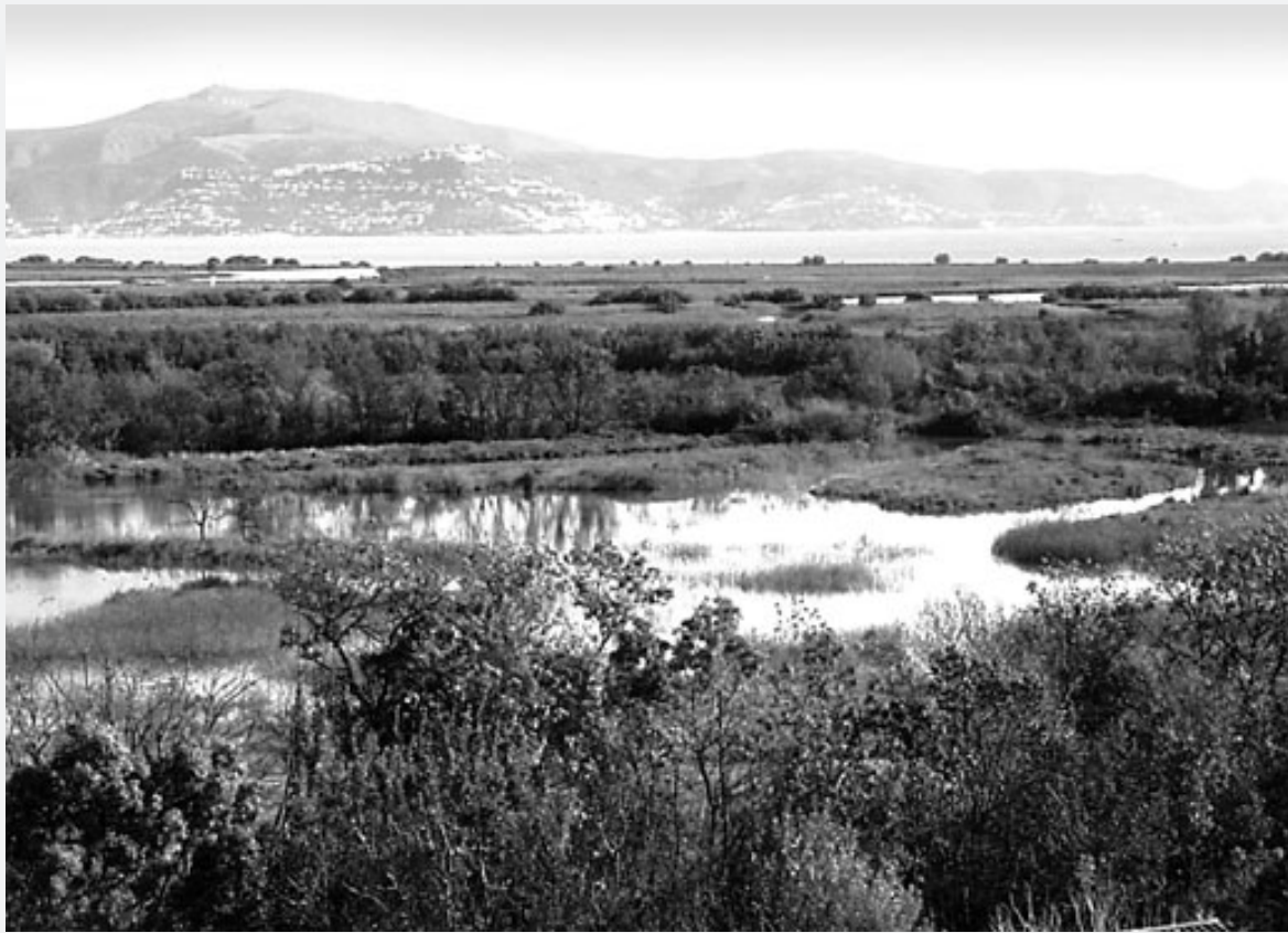
1978-1988. Continua la pressió urbanística, amb les segones residències, i es comencen a sentir crítiques per la degradació territorial. A la foto, els aiguamolls de l'Empordà, que van ser protegits el 1983.