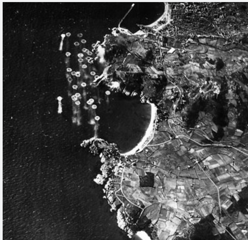
1938-1948. El drama de la guerra i la postguerra. A la foto, bombes sobre Sant Feliu de Guíxols l'11 de gener del 1939.