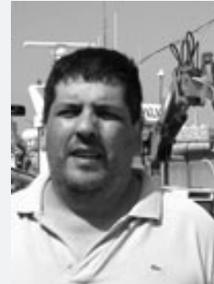
Sureda, al port de l'Escala. Els pescadors del municipi han muntat un sistema pioner perquè es pugui participar en la subhasta de peix a través d'internet.

— «Sempre se'ns acusa de sobrepesca, de perjudicar el medi ambient... Però no som pas nosaltres els que ens carreguem les praderies de posidònia. Jo recordo que, de petit, a qualsevol lloc que anessis a banyar-te n'era ple i en canvi ara ha desaparegut. I els llocs on era són llocs on les barques de pescadors no han pescat mai, són molt en terra. La contaminació, les fàbriques i els vessaments incontrolats, les llanxes, la pesca recreativa... Tot això ha tingut un gran impacte ambiental. Penseu, per exemple, que els ous de les anxoves i les sardines suren a la superfície i que les hèlices de les embarcacions esportives els trituren. I