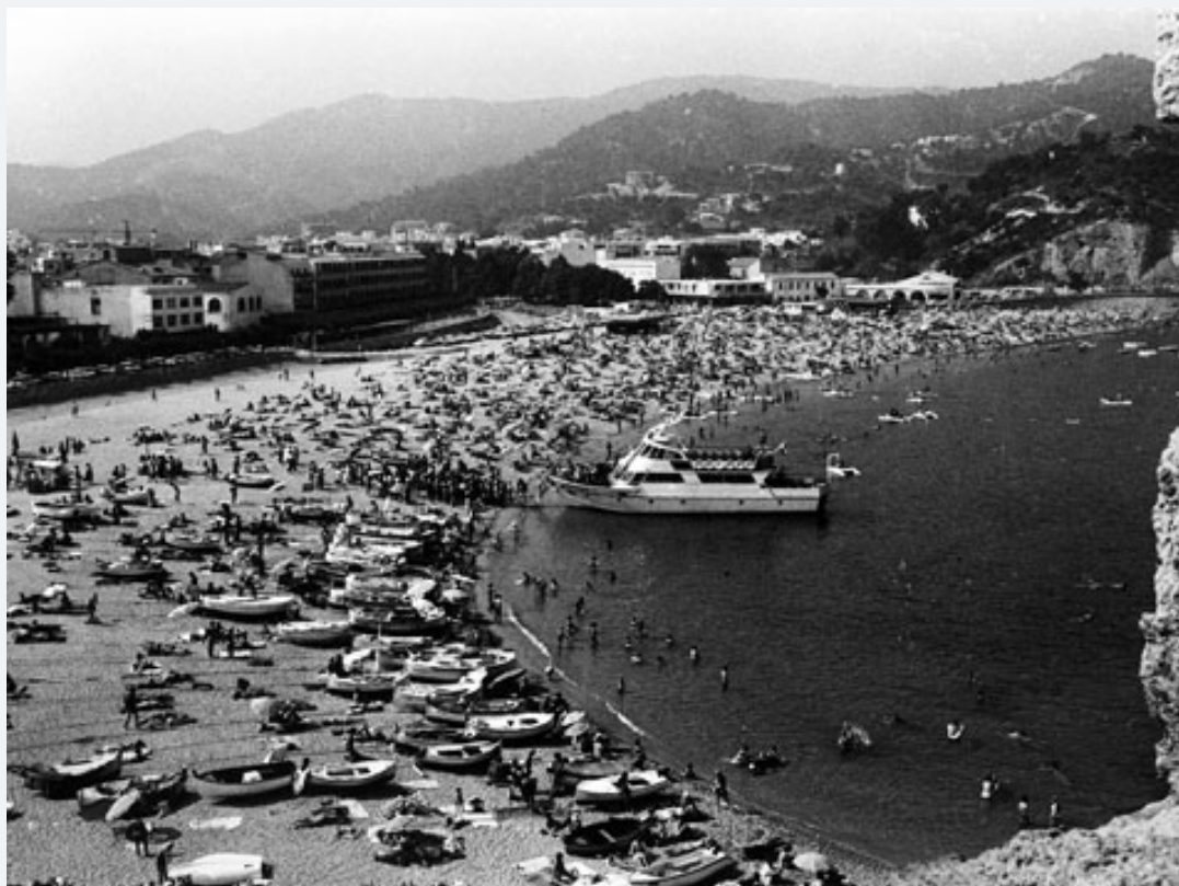
1968-1978. L'època del turisme industrial, els tour operators, la massificació i l'homogeneïtzació. La imatge és de Tossa el 1977.