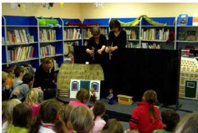
Divadélko Na nitce navštívilo 8. prosince 2010 Městskou knihovnu v Táboře, kde v dětském oddělení odehrálo pro děti z družiny Základní školy Bernarda Bolzána pohádku Perníková chaloupka.