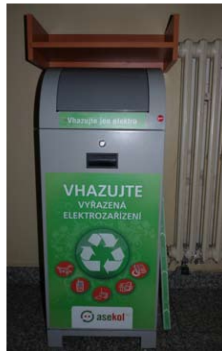
Schránka umístěna v přízemí MěÚ.

Všechny vyhlášky jsou pro občany dostupné na městském úřadě nebo na internetových stránkách města