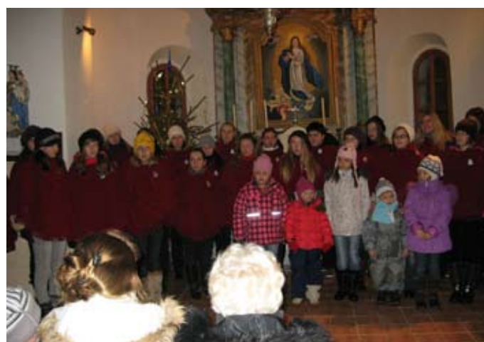
Koncert ve Zhoři.