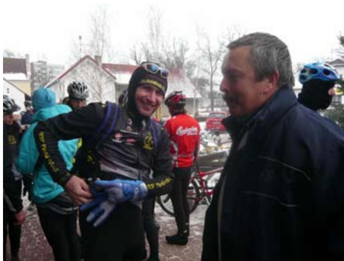
Silvestrovská cyklo vyjížďka.

• O Silvestru dopoledne se před radnicí města zastavil již podvanácté peloton cyklistů na své tradiční „Silvestrovské Bike vyjížďce“.