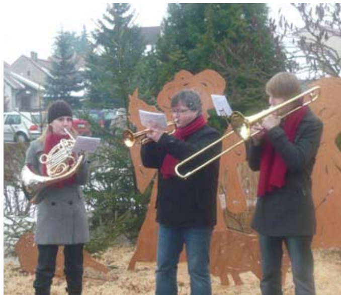
Vánoční vytrubování.

• Česká mše vánoční Jana Jakuba Ryby, v podání Har-