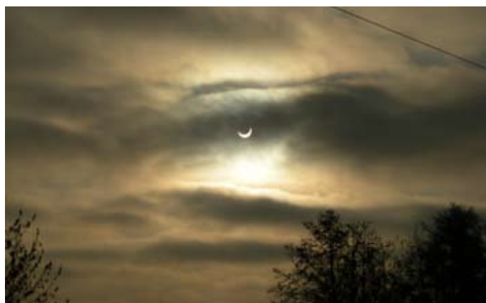
Částečné zatmění slunce pozorované dne 4. ledna 2011 z oblasti Soukenické ulice v Plané nad Lužnicí.