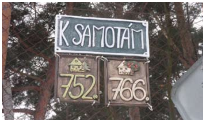
Obyvatelé ulice K Samotám