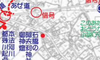
「天の園」記念碑 (唐子中央公園) 2001年5月たくさんの市民の手で建立されました