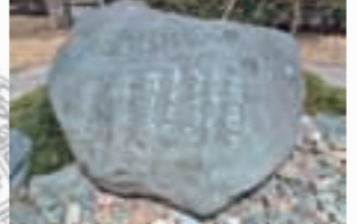
「天の園」記念碑 (唐子中央公園) 2001年5月たくさんの市民の手で建立されました