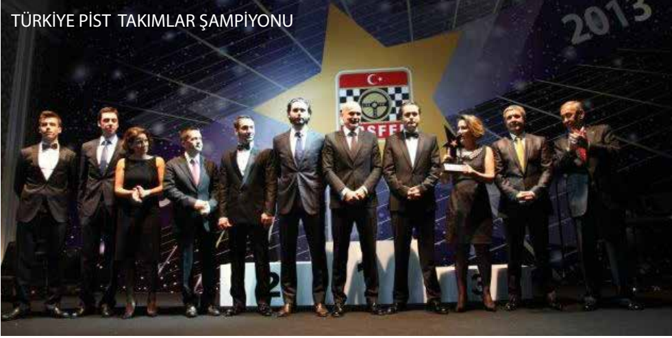
TÜRKİYE PİST TAKIMLAR ŞAMPİYONU