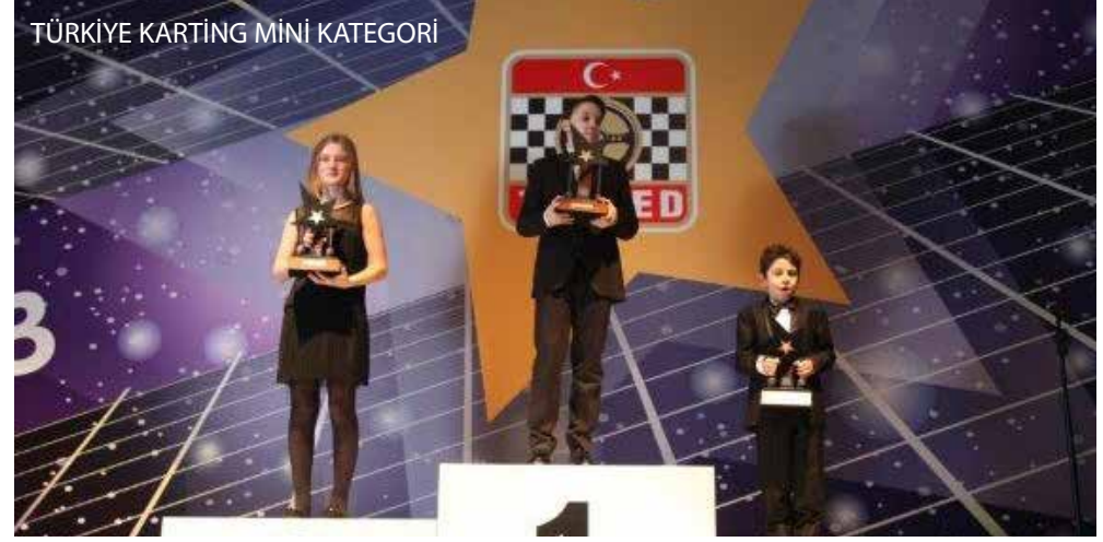
TÜRKİYE KARTİNG MİNİ KATEGORİ