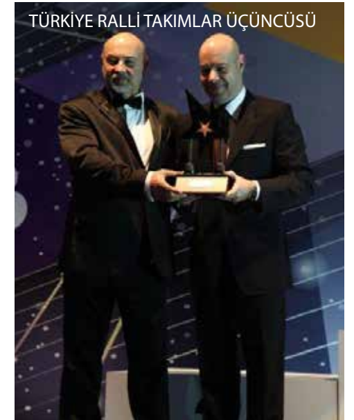
TÜRKİYE RALLİ TAKIMLAR ÜÇÜNCÜSÜ