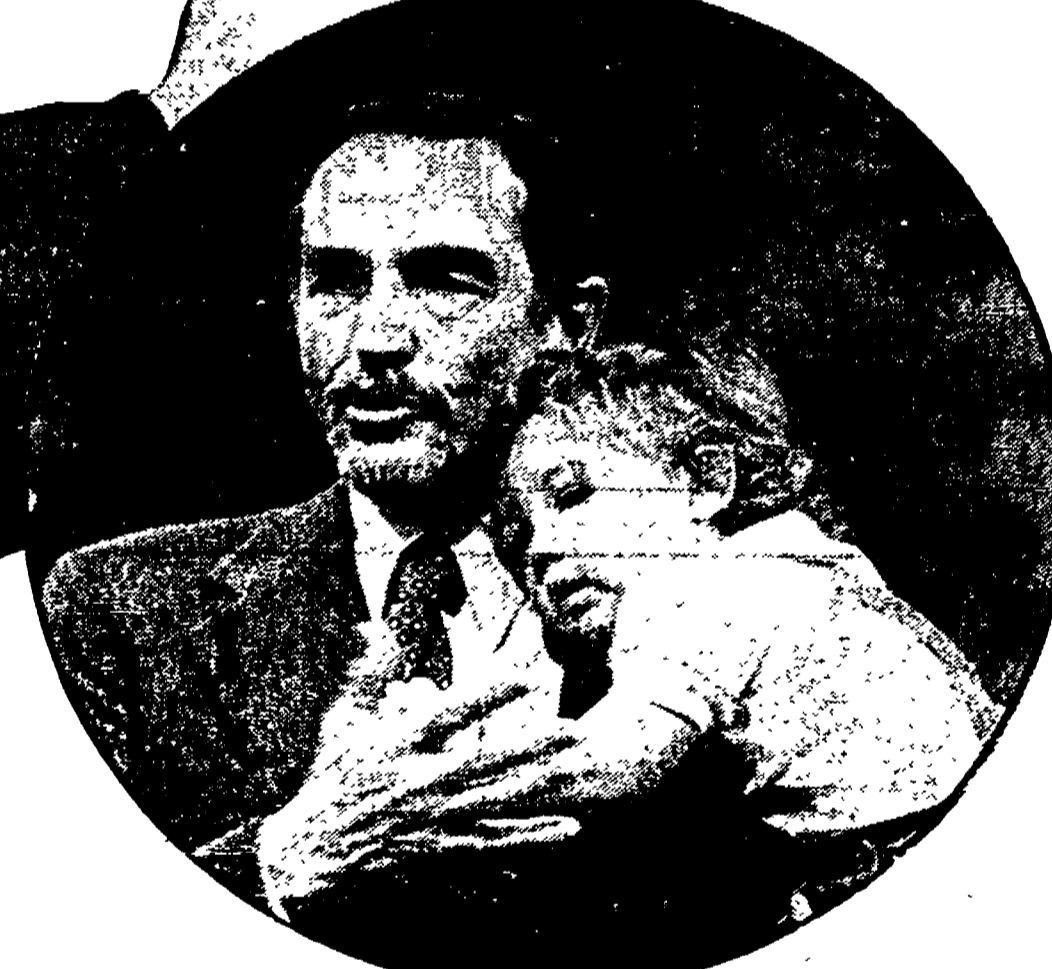
Vittorio Gassman e accanto l'attore insieme al figlio Jacopo. Uno dei protagonisti del teatro italiano racconta il suo lavoro e i suoi progetti per il futuro

MILANO — È vero: a intervistare Vittorio Gassman si corre il rischio di piombare a piedi giunti nell'ovvietà più banale. Prima di tutto perché è difficile liberarsi dei luoghi comuni dei ritratti un po' pomposistici dei suoi agiografi e quindi di riflesso — dall'idea di credere di sapere tutto di lui.