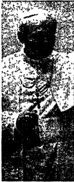
Papa Giovanni Paolo II

Israele torna l'incubo di un attacco chimico. La minaccia non è passata ma si è fatta più seria, ha avvertito il governo israeliano. La destra reclama un'azione militare immediata e chiede a Shamir di fissare un limite alla pazienza di Israele. «Saddam ha varcato da tempo la linea rossa della nostra pazienza». Ha replicato il ministro della Difesa Moshe Arens. Da Baghdad, Aziz attacca il segretario generale dell'Onu. «Si assuma tutte le responsabilità della guerra».