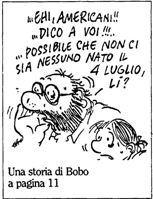
Una storia di Bobo a pagina 11