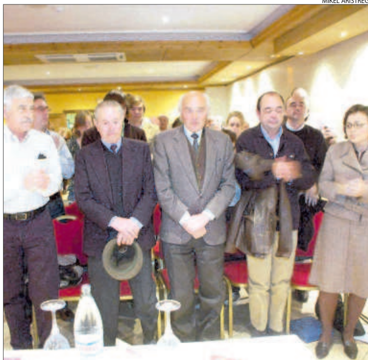
Un momento del homenaje a la escritora celebrado el pasado viernes.