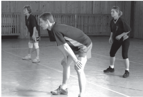
(e) Tretie miesto domácu ZSS potešilo.