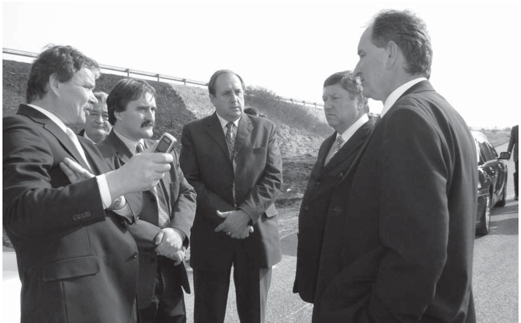
Predstavitelia mesta Senec a poslanci s ministrom dopravy Pavlom Prokopovičom na úseku, kde sa plánuje nový výjazd z diaľnice do Senca.