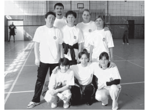
Prekvapenie turnaja - mestský úrad