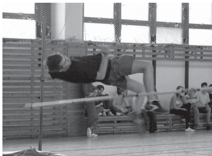
Aj keď niektorí neuspeli, zasúťažili si.