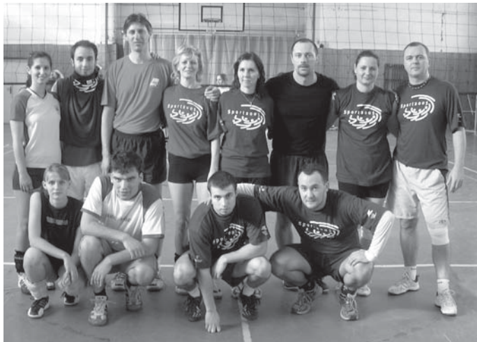
Finalisti turnaja ZSSPo Ivanka pri Dunaji a UMIC Bratislava

Poradie: 1. ZSSPo Ivanka pri Dunaji, 2. UMIC Bratislava, 3. ZSS Senec, 4. ZSSPo Bernolákovo, 5. MÚ Senec, Gymnázium Senec, ZSSZ Malinovo.