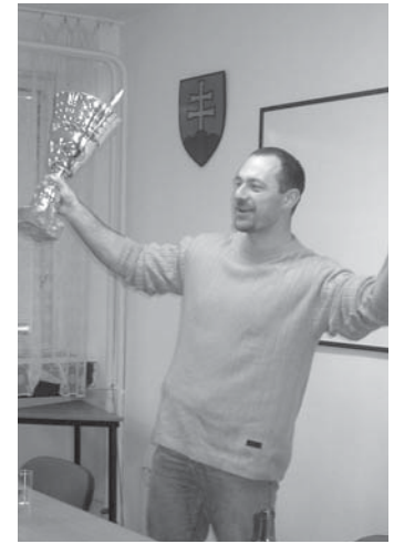
Radosť kapitána víťazného celku