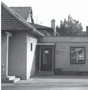
Pošta v Hrubom Šúre

Radšej ušiel. Odvážna žena skončila s tržnými ranami, pomliaždeninami a modrinami na péenke. Neskôr sa zistilo, že v hotovosti tam bolo okolo