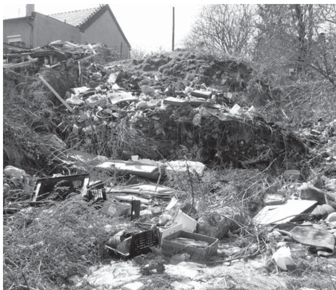
Smetisko, z ktorého vybiehajú potkany na všetky strany.