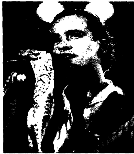
Eros Ramazzotti il 4 dicembre in diretta su Canale 5