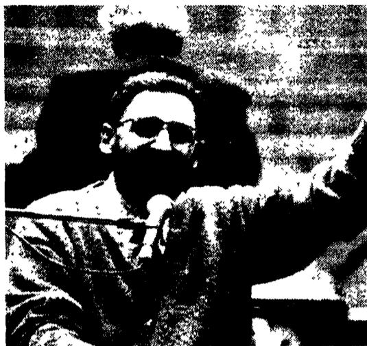
Franco Battiato durante il concerto a Santa Cecilia

Per Franco Battiato si sono aperte l'altro ieri le porte dell'Auditorio dell'Accademia di Santa Cecilia a Roma. Il cantautore siciliano si è presentato accompagnato da un'orchestra da camera, i Virtuosi Italiani, e con un repertorio che integrava canzoni di ieri, di oggi, e alcuni Lieder , in una suggestiva rilettura classica. Molti gli applausi. Il 7 gennaio prenderà il via da Casale Monferrato un tour teatrale.