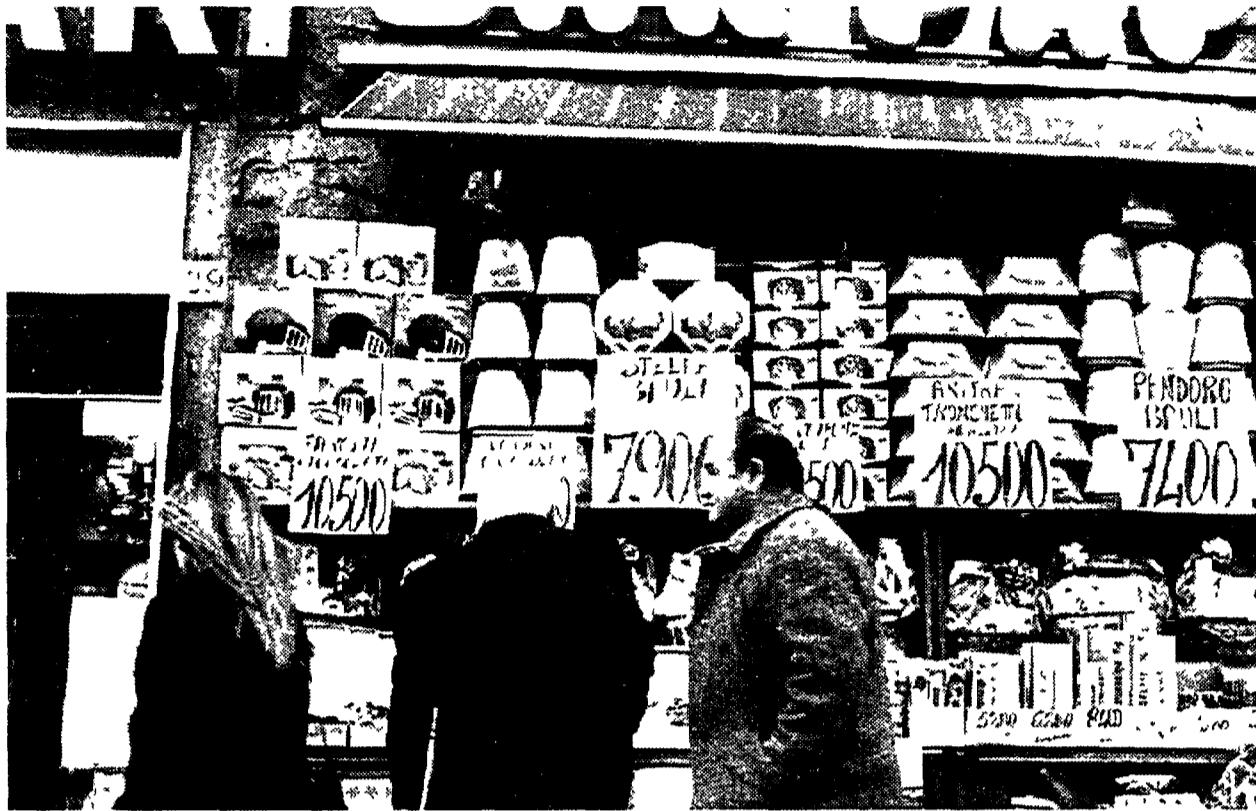
Pandori, panettoni e...