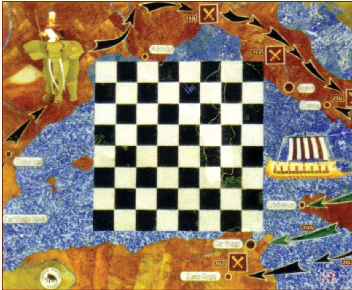
Армия Ганнибала сражается с римскими легионами Сципиона. Шахматная доска выполнена в виде карты Средиземноморья