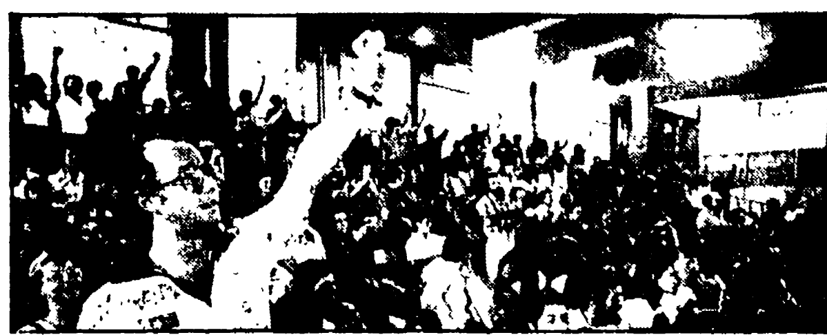
Molta gente e molti giovani agli spettacoli e ai dibattiti che si svolgono al Festival

Dibattito sulle scelte culturali e commerciali al Centro musica-scienza - I condizionamenti delle multinazionali