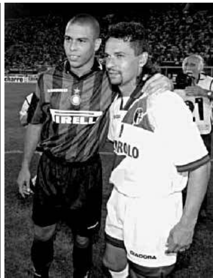
L'abbraccio tra Ronaldo e Roberto Baggio