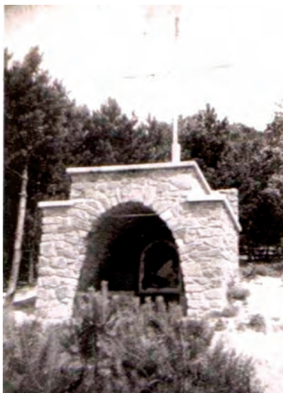
A kápolna (Soproni Szemle)