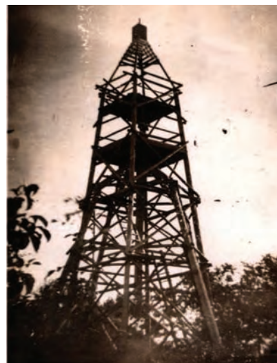
Pintytető: háromszögelési alappont

A 261 méter tengerszint feletti magasságban lévő Pintytetőn régen fa építmény jelezte a magassági pontot, amely kilátóként is funkcionált. A helyén álló mai vasbeton torony kb. 20 m magas. Ilyen geofizikai torony található az Alom-hegy tetején is. Sajnos kilátóként egyik sem használható.