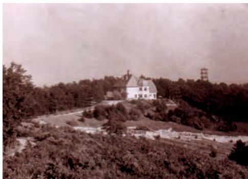
Vadászlak a kilátóval (1880)

ség vonulatát oldalában Eisenstadttal, a Fertő tavat, a kőhidai medencét, átellenben a Szárhalommal és a Kecse-hegyi kilátóval, rálátunk a Pintytetőre, a Virágvölgyre. Természetesen „lábunk előtt hever” Sopron gyönyörű városa is.