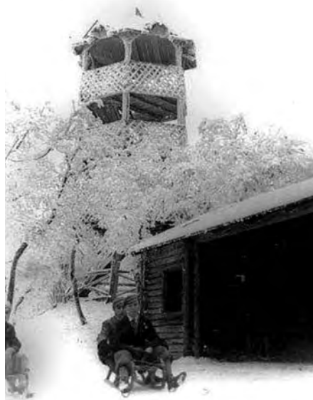
Szánkópálya indító háza (1930)