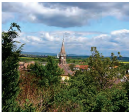
Panoráma a Ház-hegyről

1.: Ágfalváról, a Fő utcai buszmegállótól D-i irányban felfelé és az Ágfalvi gerincről ÉK-i irányban lefelé a K- jelzésű úton, majd az ebből leágazó K▲ jelzésen.