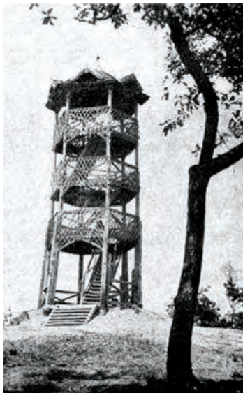
A Romwalter Károly kilátótorony (1902)