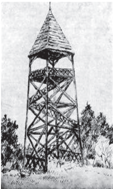
A Gloriette a Sörházdombon (1900)

A Lőverek legalacsonyabb dombja a Sörházdomb, a volt Tulipán Magaslat. A 298 méter magasan álló kilátó helyén először az 1900-ban épített gloriette állt. 1939-ben háromszögelési pontot jelöltek ki itt, melynek tornyát a turisták kilátóként használták. A II. világháború alatt összedőlt, ezért lebontották. Helyén 1969–70-ben épült új kilátó Rosenstingl Antal tervei alapján. A torony 16,5 m magas volt. A folyamatos karbantartás hiánya miatt az 1980-as évek elejére életveszélyessé vált és az is lebontásra került. A város és az erdőgazdaság együttműködésében – támogatva a civil kezdeményezést – 2006-ban a Sörházdombon új kilátó épült. A Sörházdombi kilátó a parker-