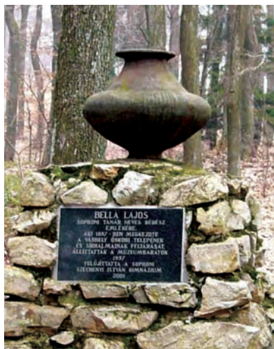
Bella emlékhely (Kilátótól DNy-ra 600 m)

ba. (Egy kis kitérőként megjegyezzük, hogy nincs új a nap alatt. A fák tördelése, a padok megfaragása, a szemetelés már akkor is előfordult. Ez ellen emelte fel szavát 1888. április 22-i számában az Oedenburger Zeitung és felkérte az erdészeket, a katonaságot, a járókelőket a rendbontók megfékezésére. A felhívást 1888. május 4-én követte egy újabb másfél hasábos cikk. Ebben kérték a lakosság önkéntes közreműködését a sétautak tisztántartásához, újabb berendezések létesítéséhez és a kilátók helyreállításához.) Az idő viszontagságainak kitett fatorony már 1896-ban javításra szorult volna, de erre csak 1909-ben került sor. A felújított kilátó sem volt azonban hosszú életű, 1929-ben újat kellett építeni helyette. Ez 1979-ig állt, amit a Somfalvi György által tervezett 1981-ben átadott – a mai formájában látható – kilátó váltott fel. Sajnos 2007-re ez is életveszélyessé vált és le kellett zárni. Sopron város önkormányzatának támogatásával a Tanulmányi Erdőgazdaság Zrt. 2009 novemberére a kilátót teljes egészében felújította, így azt ismét megnyithatták a nagyközönség számára. A Várhely kilátó adottságai