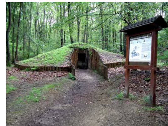
A 131. halomsír rekonstrukciója (2006)

kiválóak, s talán ebből a kilátóból nyílik a legszebb panoráma a Sopront övező erdőségekre. Észak-kelet felé Sopront, Bánfalvát, a Bécsidombot, a Fertő tavat, míg délre a Soproni hegyeket és a Rozáliát láthatjuk. Nyugatra Ágfalva, Lépesfalva, Fraknó vára és a Schneeberg tárul a szemünk elé, míg északra tekintve a Ruszti-dombsor és a Lajta-hegység látványában gyönyörködhetünk. A Várhely kilátó lábánál fekszik a korábban már említett hallstatti kultúrát bemutató történelmi emlékpark.