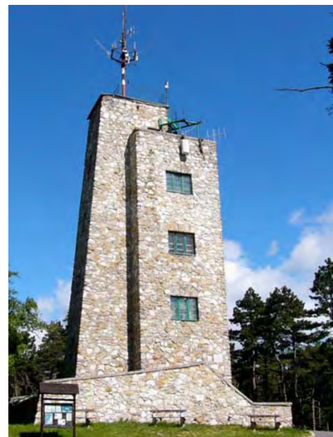
A kilátó napjainkban