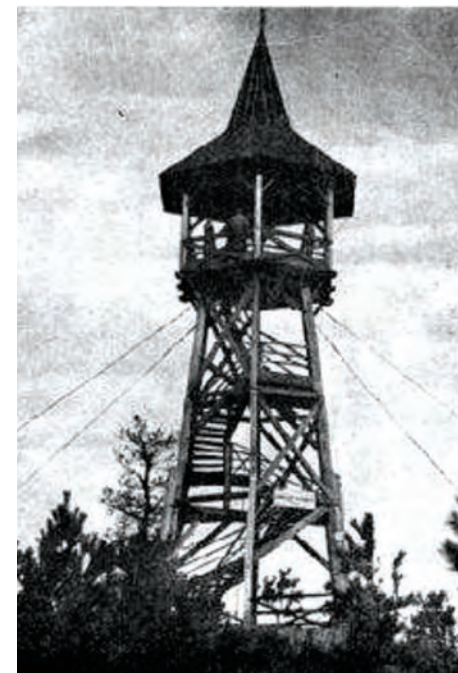
Várhely kilátó (1909)

A Soproni Parkerdő nyolc kilátója közül a Várhely kilátó az egyik legrégebbi. Ahol épült – a Sopron melletti Várhely (Burgstall) – a nyugat-dunántúli hallstatti kultúra legfontosabb lelőhelye. Ez az i.e. 7-4 századbéli kora vaskori kultúra nyugatról-keletre a Szajnáttól a Duna magyarországi szakaszáig, északról-délre pedig a Német Középhegységtől Szlovéniáig terjedt. Sopron környékének kiemelkedő jelentőséget biztosított ebben az időben a távolsági kereskedelem egyik legjelentősebb útvonala a Borostyánkő út, ami a soproni-hegyek