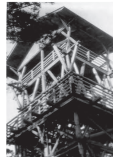
1970-ben készült fotó

A kilátó remek kilátást nyújt az egész városra, a Fertő-tóra és a Soproni hegység erdővel borított lejtőire. Szép idő esetén a Schneeberg és a Rax vonulatai, sőt Pozsony és Bécs szélkerekei is láthatók.