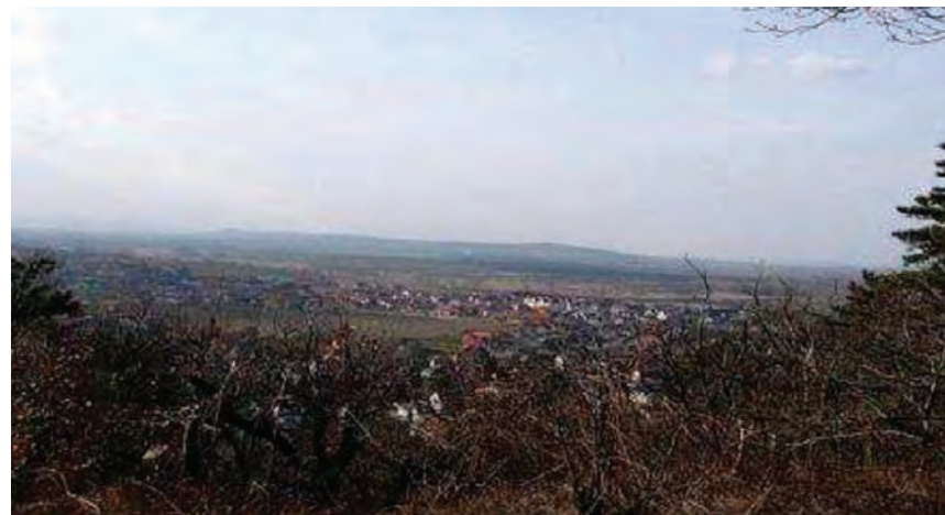
Kilátás a Gloriettről

Magassága kb. 8 méter, járószintje 3 méter. A kilátóból szép kilátás nyílik a Várhely, a Karmelita templom, Bánfalva, a Rozália-hegység és a Schneeberg irányába.