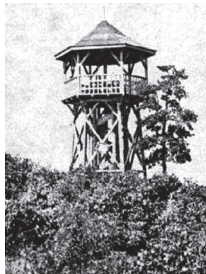
Kecse-hegyi kilátó (1905-1938)

A Szárhalmi-erdőben a 208 m tengerszint feletti magasságú Kecse-hegy már a korai vaskor idején emberlakta település volt; később a rómaiaknak lehetett rajta erődítményük. Az első kilátó (1905–1938)