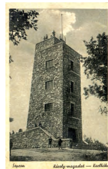
A kilátó 1939-ben