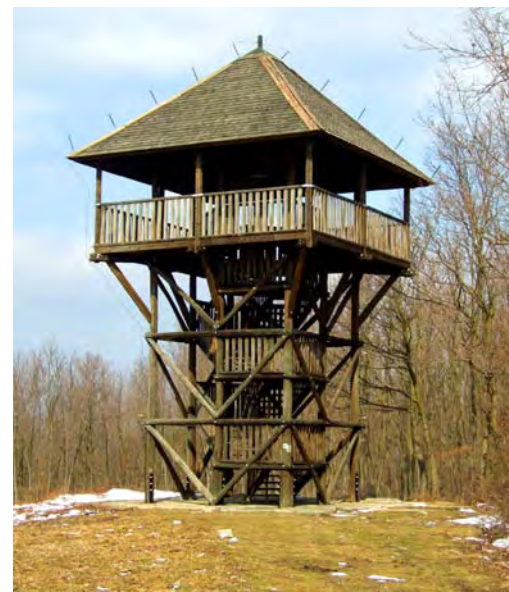
A mai kilátó