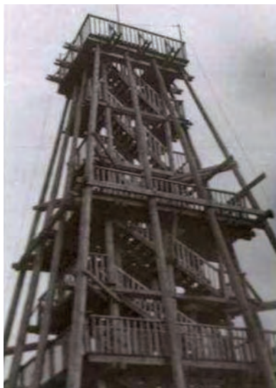
1970-es években

A soproni hegyvidéken található 467 méter magas Poloskásbércen az 1970-es évek elején végrehajtott fakitermelés után derült ki, hogy a gerincről szép kilátás nyílik Görbehalomra, Brennbergbányára és Ausztriára. Így 1972-ben meg is épült egy nyitott tetejű hatszintű fa kilátó, ami 22 méter magas volt. A Béke nevet kapott kilátót Somfalvi György tervezte, az idő vasfoga azonban kikezdte és 1993-ban el kellett bontani. A betonlap viszont megmaradt és Hadas László segít-