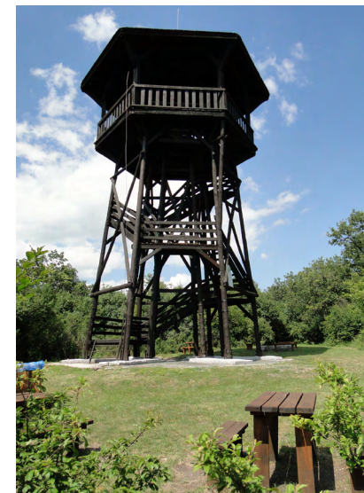
Kecse-hegyi kilátó (2013)