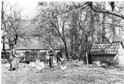
Delden. Bij de boerderij Lankamp.