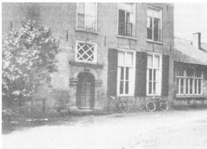
Het bijna vergeten poortje van de voormalige pastorie; teruggehaald uit Valburg.