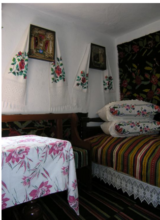
Музей етнографії, Буша

Кам'яні хрести XIX ст., що тут збереглися, є цінними пам'ятками місцевого народного каменярства. Вони виготовлені із місцевого каменю-пісковика, значні поклади якого виявлені в навколишній місцевості. На виготовлення хрестів припадав найбільший відсоток серед іншої