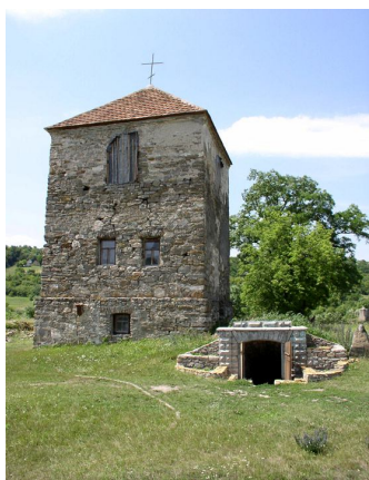
Вінничина, Буша. Державний історико-культурний заповідник «Буша».