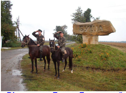
Вінничина, Буша. Державний історико-культурний заповідник «Буша».