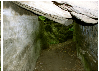
Державний географічний заповідник «Гайдамацький Яр»