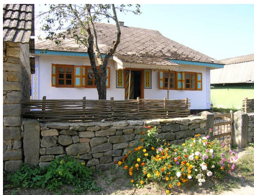
Музей етнографії, Буша

Старий сільський цвинтар у Буші також входить до комплексу об'єктів історико-культурного заповідника.