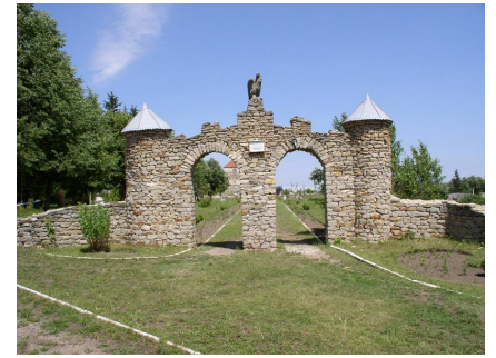
Вінничина, Буша. Державний історико-культурний заповідник «Буша».