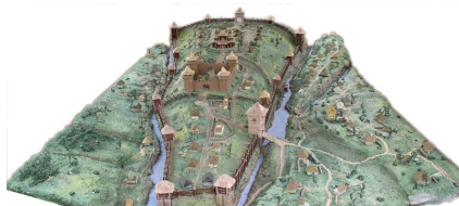
Вінничина, Буша. Державний історико-культурний заповідник «Буша».