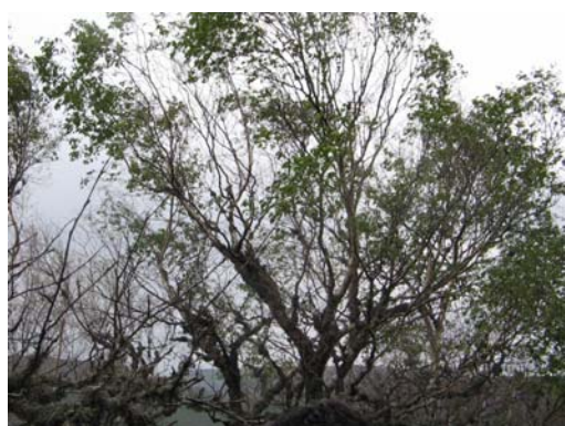
Figura 1. Efectos de la defoliación en Ancares-Caurel.