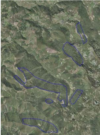
Figura 3. Ortofoto y croquis de las zonas con trampas.