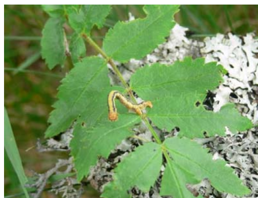
Figura 2. Oruga de Agriopsis aurantiaria .