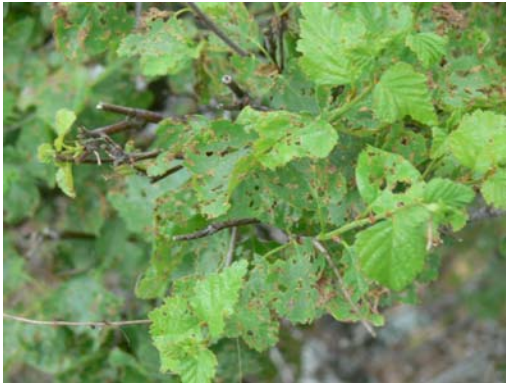
Figura 5. Detalle de la defoliación.